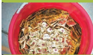
安全套大受運動員歡迎。網上圖片

仁川亞運會今晚才正式揭幕,提早抵埗的運動員未比賽先瘋搶紀念品,不過各國選手看中的並非3隻吉祥物「風」、「舞」、「光」的官方製品,而是選手村內免費派發的安全套,據稱每日派發的5千個安全套均遭到秒搶。