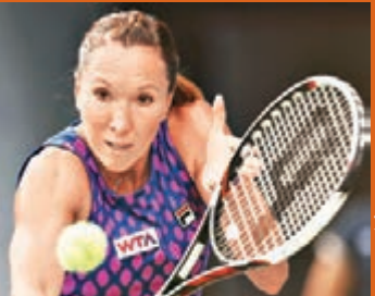
贊高域連輸2盤出局。

女網前「世界第一姐」贊高域昨日在東京舉行的泛太平洋賽次圈賽事,意外以6:7和4:6的盤數不敵西班牙新銳穆古魯薩,無緣躋身8強。同日的另一場次圈賽事,澳洲球手迪拉古亞以6:2和6:4的盤數擊敗新西蘭球手伊蘭高域,順利晉級。