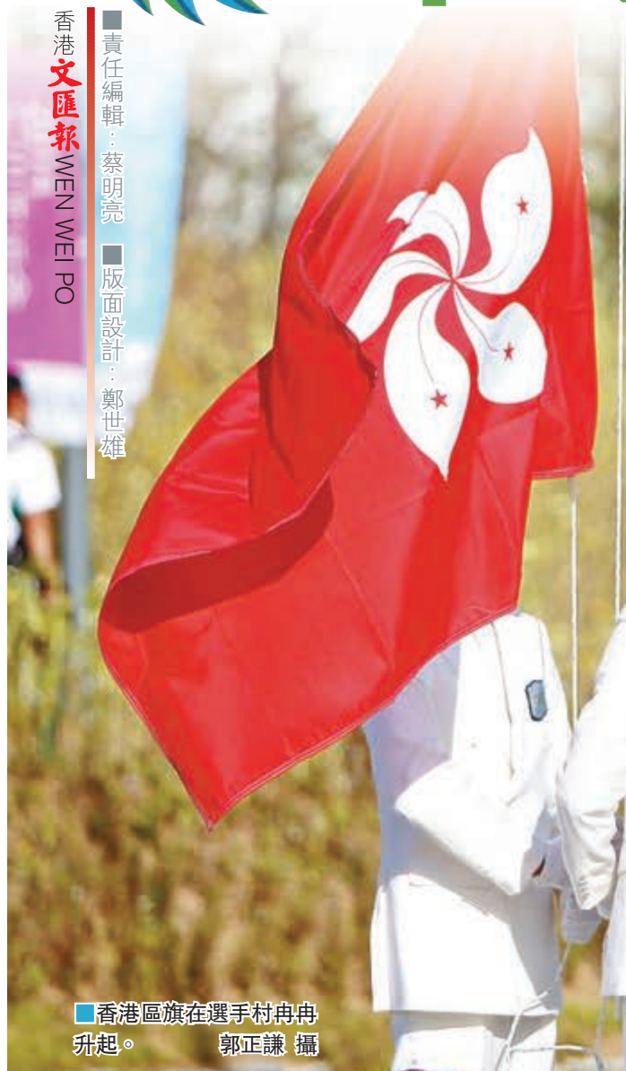
香港區旗在選手村冉冉升起。