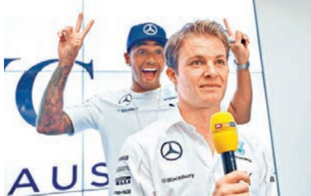
威美頓(後)在羅斯保身後搞鬼。