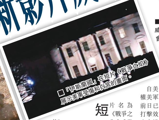
「伊斯蘭國」在短片《戰爭之焰》(Flames of War)中,展示美軍受傷和自宮的畫面。

ISIL近日更透過網上聊天室徵召「獨狼」恐怖分子,到美國紐約時代廣場等人群聚集的地方發動恐襲。ISIL前日再發布短片,威脅將襲擊美軍和白宮。分析認為,ISIL發布影片是要回應同日較早時,美軍參謀長聯席會議主席鄧普西稱不排除派地面部隊赴伊拉克的言論。