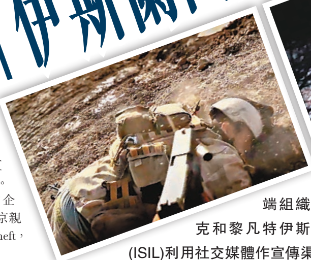
極端組織「伊拉克和黎凡特伊斯蘭國」(ISIL)利用社交媒體作宣傳渠道,吸引全球各地不少支持者投效。

ISIL近日更透過網上聊天室徵召「獨狼」恐怖分子,到美國紐約時代廣場等人群聚集的地方發動恐襲。ISIL前日再發布短片,威脅將襲擊美軍和白宮。分析認為,ISIL發布影片是要回應同日較早時,美軍參謀長聯席會議主席鄧普西稱不排除派地面部隊赴伊拉克的言論。