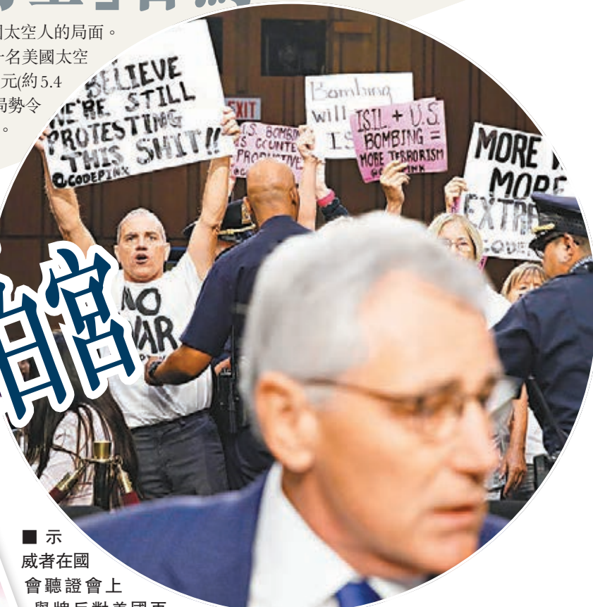
示威者在國會聽證會上舉牌反對美國再派兵伊拉克。前為作證中的防長哈格爾。

ISIL在網上聊天室形容,時代廣場是紐約市最重要和著名的旅遊景點,得州也是目標之一,但未有解釋原因,其他襲擊目標還包括美歐的火車隧道。ISIL又發表文章,詳細教導如何利用廚房日常用品製造