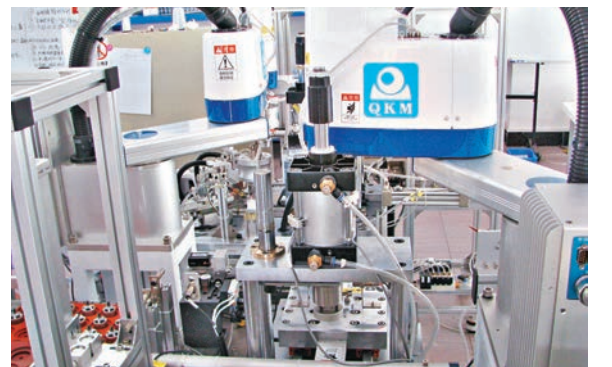
港企引進的機器人包裝生產線。

記者從多家港企了解到，目前大部分港資企業都有意願引入智能化生產線，但憂慮其高成本在三年內無法回