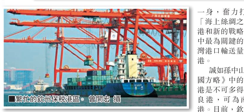
■繁忙的欽州保稅港區。

據了解，欽州市是廣西北部灣經濟區的中心城市，憑藉一系列的特殊政策和「自強實幹，融和共贏」的新時期精神，欽州創造了北部灣奇蹟，刷新北部灣速度，進入工業總產值超千億元、財政總收入超百億元地級市行列。在國家權威部門發佈的《中國城市綜合競爭力藍皮書》顯示：欽州已躋身中國「競爭力提升最快」的城市前列。 目前，欽州市堅持以港口為龍頭，港工城聯動發展，努力建設中國—東盟自貿區升級版及西南中南地區開放發展新的戰略支點，集區位、港口、平台等多重優勢於 一身，奮力打造21世紀「海上絲綢之路」的門戶港和新的戰略支點，而其中最為關鍵的則是環北部灣港口輸送量最大的欽州港。 誠如孫中山先生在《建國方略》中的規劃，欽州港是不可多得的天然深水良港，可為南方第二大港。目前，欽州已建成各類泊位98個，30萬噸級航道及包括8個10萬噸級集裝箱碼頭在內的萬噸級以上泊位近30個，30萬噸油碼頭將於2014年建成運營，成為全國少有的能進出30萬噸級巨型船舶的大港，港口吞吐能力接近1億噸。開通至香港、台灣高雄、新加坡、泰國、越南等班輪航線，2013年港口輸送量突破6000萬噸，集裝箱輸送量突破100萬標箱，2015年集裝箱輸送量將突破100萬標箱。 毫無疑問，欽州港不僅是環北部灣各港之首，也正成為面向東盟開發合作區的區域性國際航運中心。