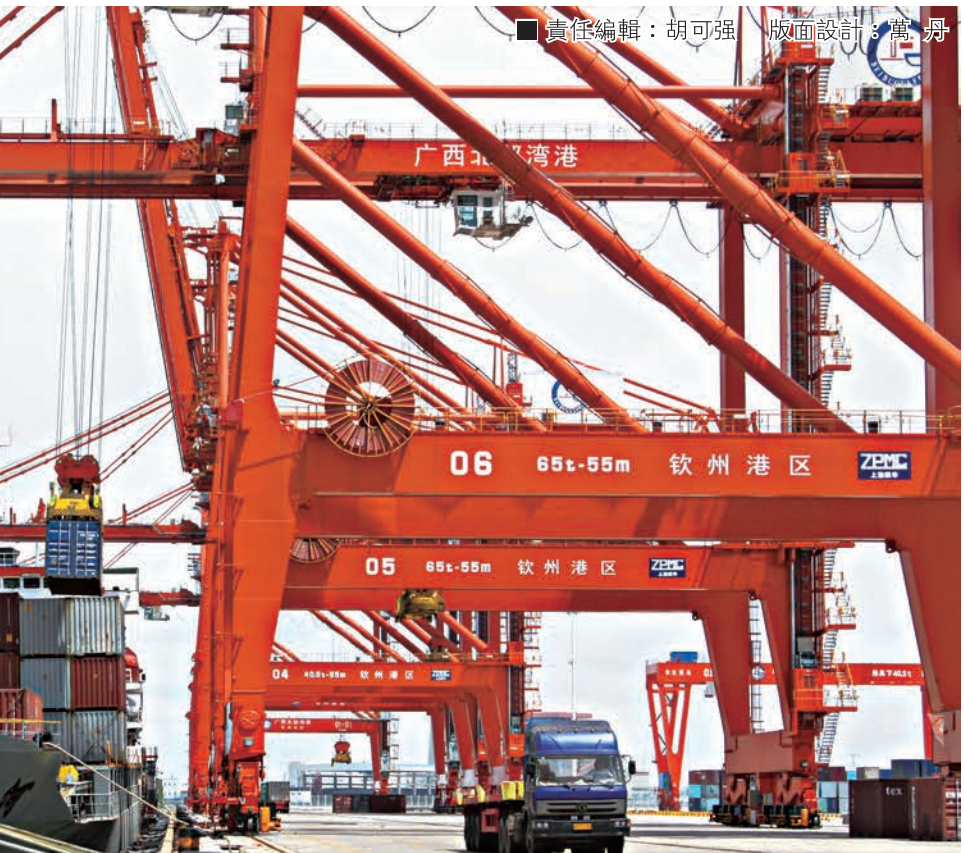
■繁忙的碼頭作業。