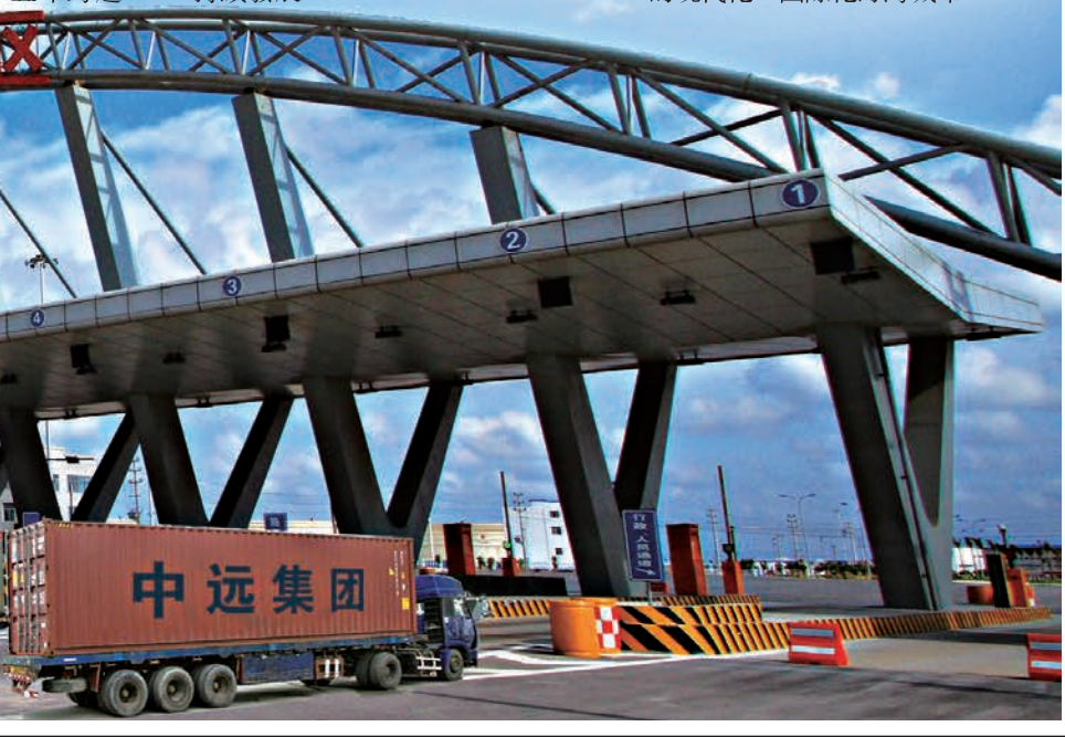
■中馬欽州產業園區。

借力建設21世紀「海上絲綢之路」的機遇，欽州根據自身情況制定了「五年跨越、十年巨變」的發展目標。在未來一段時期，欽州市將努力發揮好作為北部灣沿海中心城市在港口、區位、平台、政策等方面的多重優勢，全面融入建設21世紀「海上絲綢之路」、打造西南中南開放發展新的戰略支點等國家戰略，努力建設成為區域性國際航運物流樞紐、產業合作樞紐、市場交易樞紐和宜商宜居海灣新城。 其中，加快推進「五年跨越、十年巨變」奮鬥目標則是工作重心。「五年跨越」指經過「十二五」的持續努力，欽州發展實現大跨越，主要經濟指標穩居全區前列。到2015年，力爭全市地區生產總值與「十一·五」末相比實現五年增三倍，達到1500億元左右，人均生產總值和城鄉居民收入提前五年實現全面小康社會目標，欽州港建成億噸大港，現代產業蓬勃發展，城市服務功能不斷完善，對外開放程度明顯提高，經濟社會協調持續發展。 「十年巨變」則是經過「十二五」和「十三五」的不懈奮鬥，欽州發展實現巨大變化，邁入全國經濟發達城市行列。到2021年，即建黨100周年之際，力爭全市地區生產總值與「十一·五」末相比實現十年翻三番，達到4000億元左右，人均生產總值達到1.5萬美元左右，城鄉居民富裕程度普遍提高，建成更高水平的全面小康社會，欽州發展成為經濟充滿活力、人民幸福安康、社會和諧穩定、生態環境優美的現代化、國際化海灣城市。