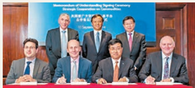
港交所、LME、LME Clear與建行於倫敦就發展新產品及聯合市場推廣等事宜簽訂戰略合作備忘錄。