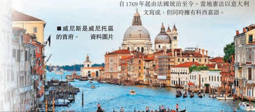
■ 威尼斯是威尼托區的首府。資料圖片

科西嘉島位於地中海，距離意大利比法國更近，自1769年起由法國統治至今。當地憲法以意大利文寫成，但同時擁有科西嘉語。