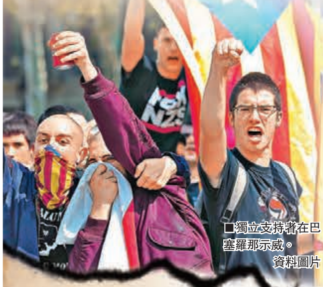
獨立支持者在巴塞羅那示威。

承諾推動獨立的巴斯克民族主義黨指出，當地需時間彌補「埃塔」遺留下來的後果，又認為馬德里拒絕與「埃塔」和解，是想藉此阻礙巴斯克獨立運動。至於應否把法國南部巴斯克語地區納入獨立後的版圖，分離組織之間仍有分歧，令獨立運動受阻。