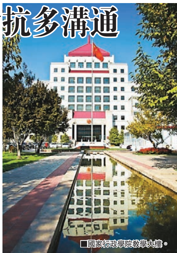
國家行政學院教學大樓。

她又希望年輕人不要隨便罷課，應該多學知識為香港服務，不要把光陰放在示威和對抗行動上。葉劉淑儀續說，國家領導人今日將會見新民黨訪京團，討論政改、「佔中」、香港未來發展以及香港與國家之間的關係等，訪京團會反映港人意願。消息指，新民黨今日將會與主管港澳事務的全國人大常委會委員張德江會面。