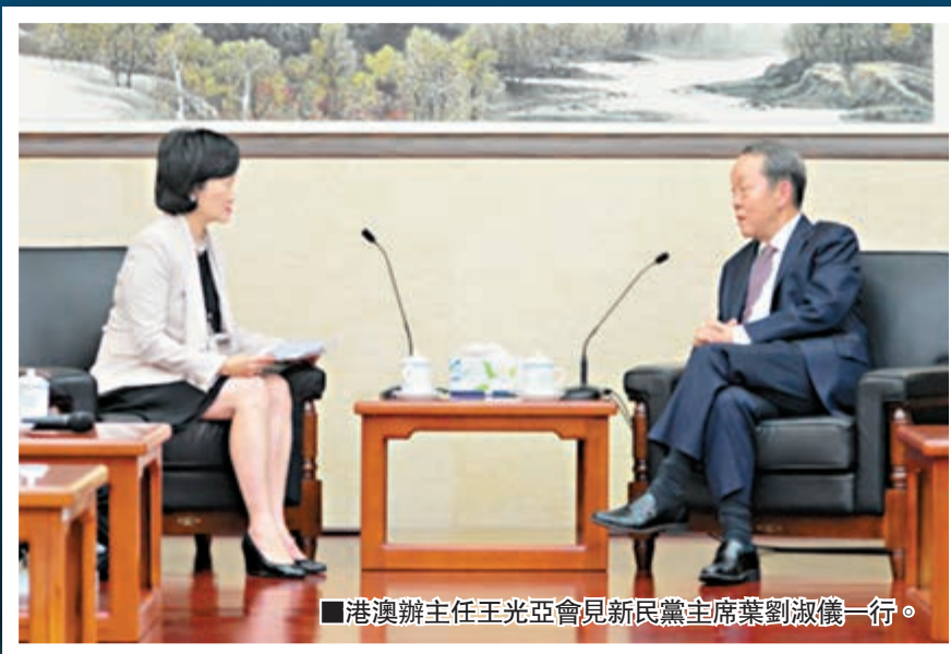
港澳辦主任王光亞會見新民黨主席葉劉淑儀一行。

香港文匯報訊（記者 江鑫嫻、實習記者 陳佩君 北京報道）國務院港澳辦主任王光亞昨日在北京會見新民黨訪京團，雙方討論政改等問題。新民黨會後引述，王光亞強調中央政府堅定不移支持香港2017年普選特首，並透露自己曾與反對派議員接觸，明白他們擔心出路問題，呼籲反對派回到正軌，依照香港基本法及全國人大常委會的決定，「他們一樣有發展空間。」王光亞又指香港有太多注重私利的政客，建議香港多培育一些真正為香港謀福利、說真話的政治家。