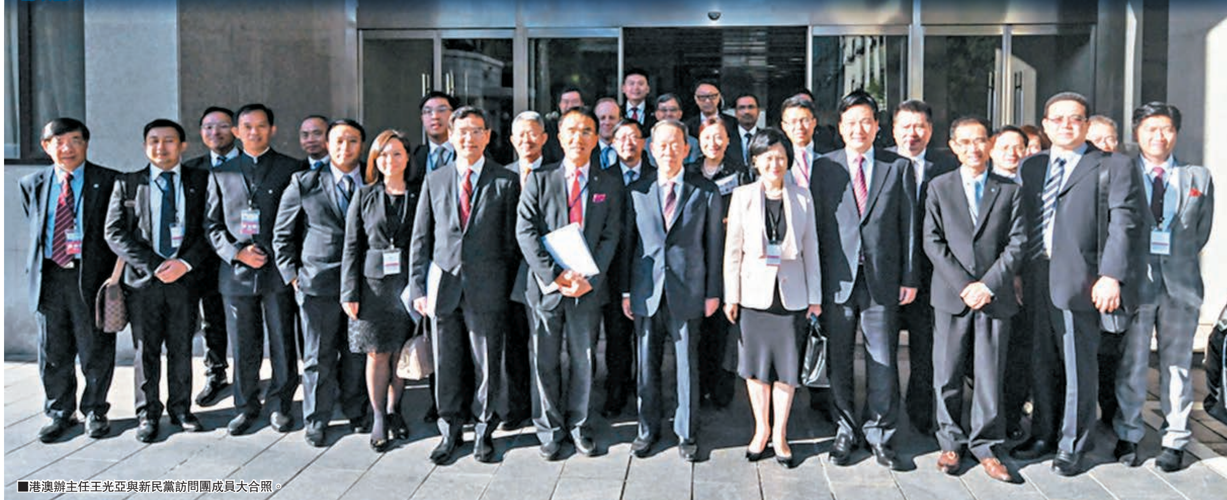
港澳辦主任王光亞與新民黨訪京團成員大合照。

新民黨訪京團昨日下午與王光亞主任會面近一個半小時，香港中聯辦副主任林武等出席會見。新民黨主席葉劉淑儀會後引述，王光亞強調中央堅定不移支持香港2017年普選特首。她又引述王光亞透露自己曾與反對派議員私下接觸，明白他們擔心出路問題，而中央從來沒有說過他們全部都不愛國愛港，雙方還有討論空間，又指長期做反對派亦沒有意義，呼籲反對派回到正軌，在香港基本法和全國人大常委會決定的框架之下，「他們一樣有發展空間。」