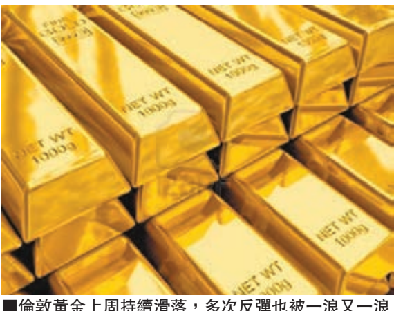
倫敦黃金上週持續滑落，多次反彈也被一浪又一浪的沽盤打回去。