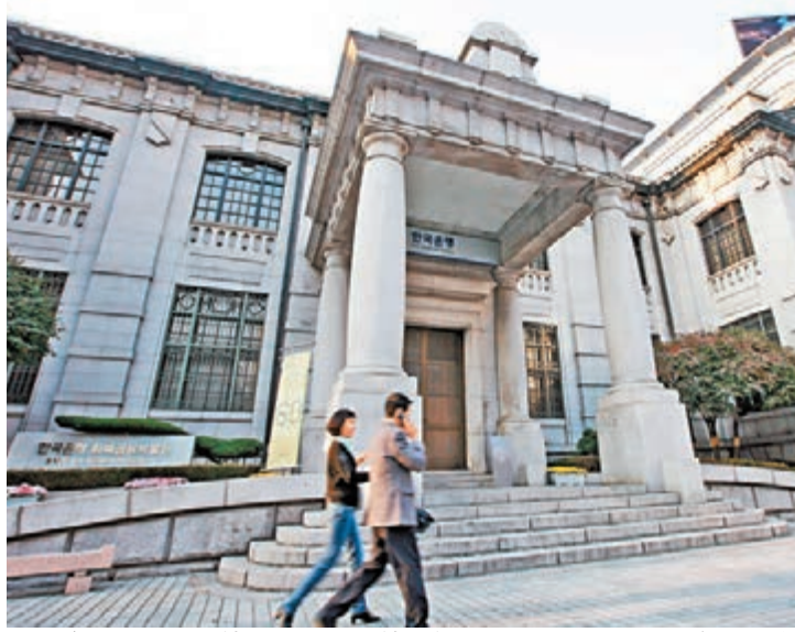
圖為位於首爾的韓國央行——韓國銀行。

由於韓國官方公布8月出口微跌，並低於市場預期，觸發市場擔心該國瀕臨通貨緊縮。在低增長夢魘困擾下，拖累首爾綜合中秋假期三天後走勢再度下跌。然而投資者倘若憧憬韓基本面向上，會推動其股市有力更上層樓，不妨留意伺機佈局建倉。 ■梁亨