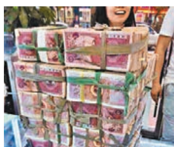
5毛紙幣一捆有千張，共500元。

「就用這些錢買手機。」浙江溫州一家手機店日前來了一位神秘男子，扛來3個裝滿5毛紙幣的麻袋，足足有好幾十捆共4萬餘張，張口就要買5部「土豪金」蘋果5S手機。讓店內所有人頓時都訝異得「石化」了。有人在邊上偷偷地笑，還有人趕緊拿出手機拍照。