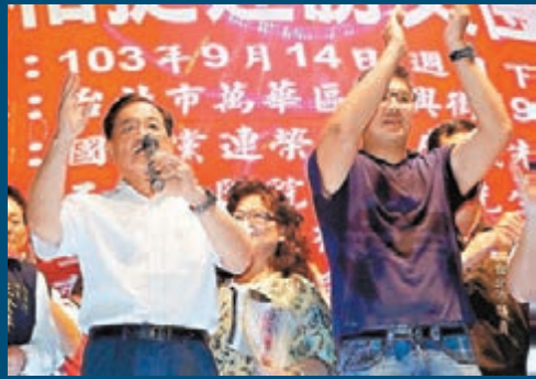
連戰(左)首次公開站台力挺連勝文(右)。

香港文匯報訊 據今日新聞網及中新社報道，中國國民黨第19次全代大會(全代會)第2次會議昨日在嘉義市舉行。黨主席馬英九致詞時表示，民進黨過去6年多來92次霸佔主席台、癱瘓議事，踐踏多數表決的民主精神，使朝野之間沒有溝通對話，只有無止境的拖延杯葛，「是當前台灣民主最大的危機」。