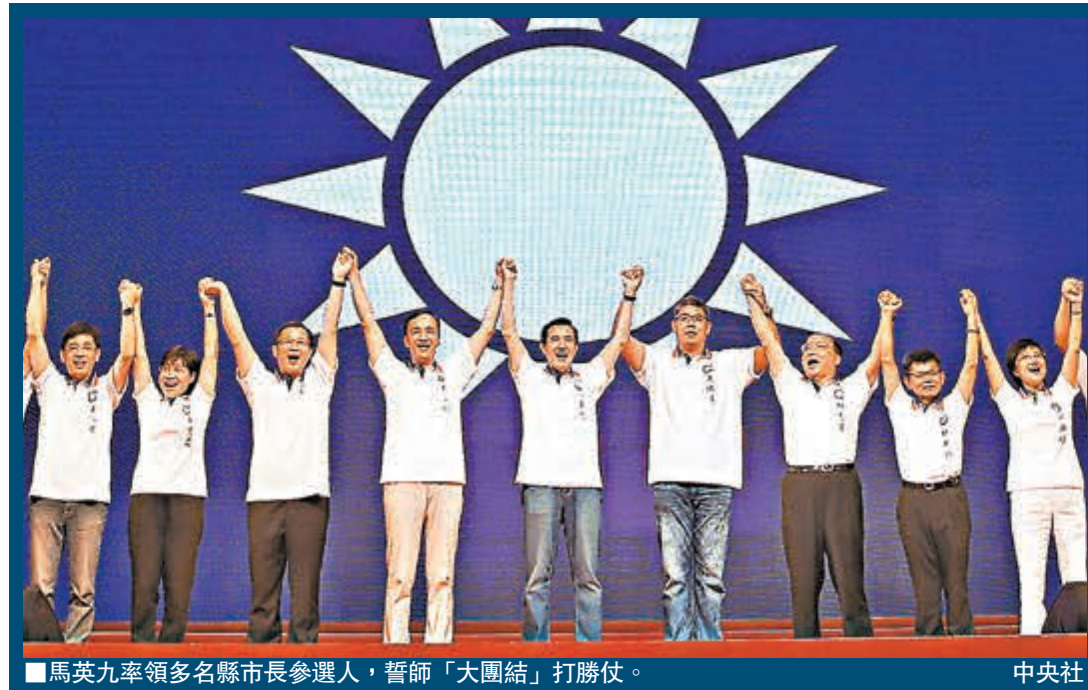
馬英九率領多名縣市長參選人，誓師「大團結」打勝仗。