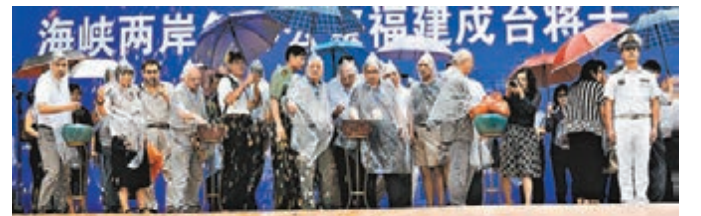
參加公祭儀式的嘉賓沿祭台拋撒手中花瓣。