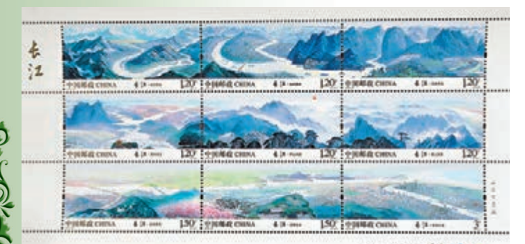
《長江》特種郵票一套共9枚。