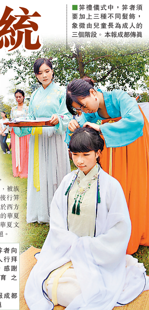
笄禮儀式中，笄者須要加上三種不同髮飾，象徵由兒童長為成人的三個階段。本報成都傳真