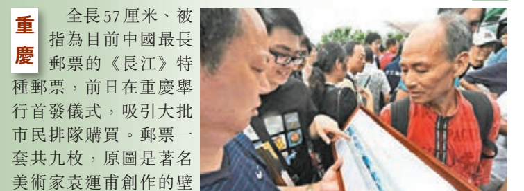
九國連印的長卷版《長江》特種郵票。

重慶 全長57厘米、被指為目前中國最長郵票的《長江》特種郵票，前日在重慶舉行首發儀式，吸引大批市民排隊購買。郵票一套共九枚，原圖是著名美術家袁運甫創作的壁畫原稿《長江萬里圖》。為表現長江萬里奔騰的氣勢，中國郵政推出九國連印的長卷版本。九枚郵票圖名分別為：大江東去、山水重慶、三峽奇觀、楚湘臨江、廬山水韻、黃山獨秀、金陵春曉、江畔水鄉、東流入海。其中「山水重慶」、「三峽奇觀」兩枚為重慶景物，呈現出主城區渝中半島及雙門景觀。據了解，《長江》特種郵票是國慶65周年的獻禮之作，全套面值13.20元。