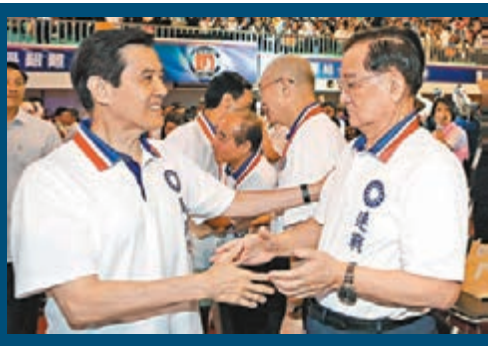
馬英九(前左)與連戰(前右)握手致意。