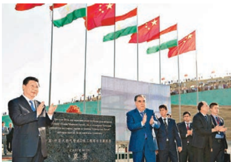
■習近平和拉赫蒙共同出席中亞—中國天然氣管道D線塔國境內段開工儀式。

習近平在開工儀式上強調，中亞—中國天然氣管道是多方參與、共同受益的戰略性合作項目，對推