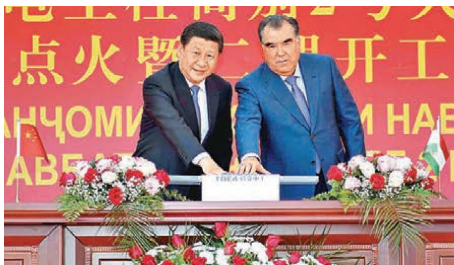
■習近平和拉赫蒙共同出席杜尚別2號熱電廠一期工程竣工暨二期工程開工儀式。新華社

香港文匯報訊 中國國家主席習近平和塔吉克斯坦總統拉赫蒙於13日下午共同出席中塔兩國重大合作項目——杜尚別2號熱電廠一期工程竣工暨二期工程開工儀式和中亞—中國天然氣管道D線塔國境內段開工儀式。