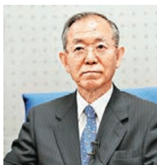
■前日本駐華大使丹羽宇一郎。

安倍表示，日中兩國是不能割離的鄰居關係，中國是日本最大的貿易夥伴，日本從中國的經濟發展中獲得了利益。同時，大量日本企業的對華投資，也使得1,000萬中國人獲得了就業的機會。兩國關係是互惠的關係。