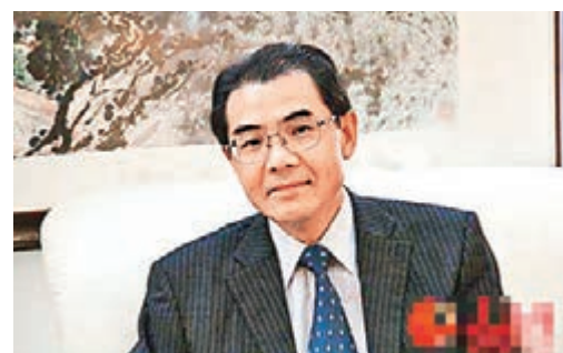
■中國駐斯里蘭卡大使吳江浩。

香港文匯報訊 在中國國家主席習近平即將對斯里蘭卡進行國事訪問前夕，中國駐斯里蘭卡大使吳江浩接受新華社記者專訪時說，這是中國最高領導人首次訪問斯里蘭卡，具有里程碑意義。