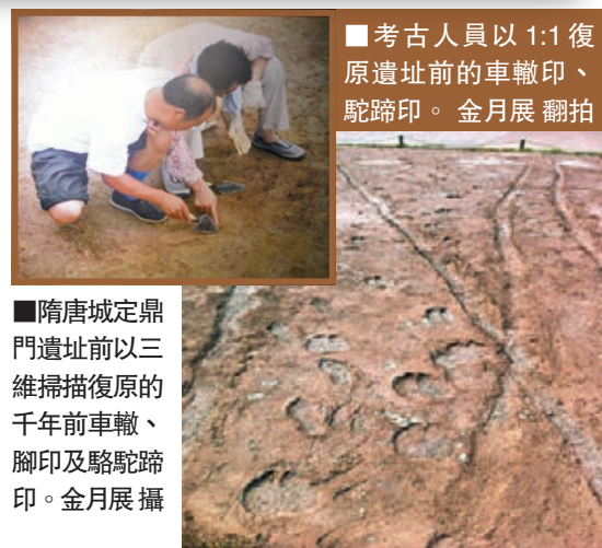
■考古人員以1:1復原遺址前的車轍印、駱駝蹄印。

「所有遺產保護的最高境界就是維持其原真性，保護遺產不僅是爲了保護，也讓更多的人能享受到遺產保護的成果。」王閣稱，洛陽新入選的這幾處世界遺產都是土遺址，在觀賞性上不如龍門石窟那麼有看頭，所以文物部門就運用各種技術手段，盡力還原被深埋在地下遺址展示給大家。比如隋唐城定鼎門遺址前的「駱駝蹄印」展示，就是運用三維掃描技術，將發掘出來的駱駝蹄印資