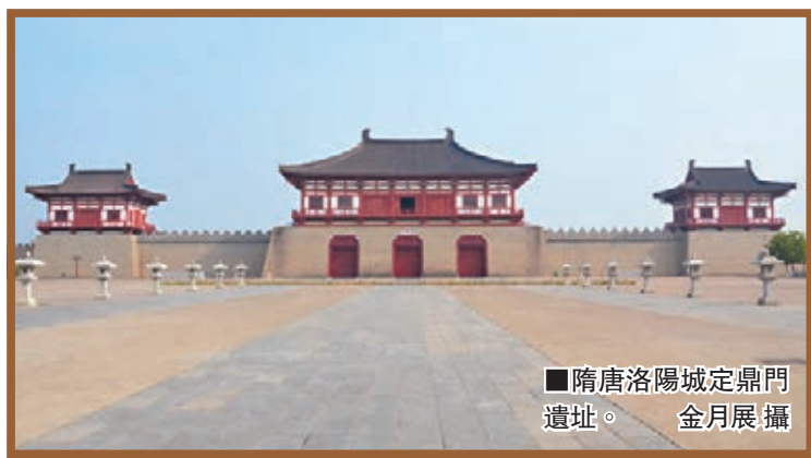
■隋唐洛陽城定鼎門遺址。