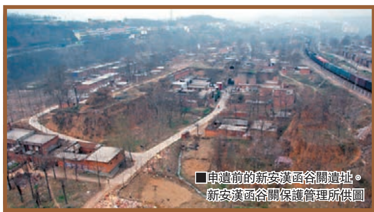
■申遺前的新安漢函谷關遺址。