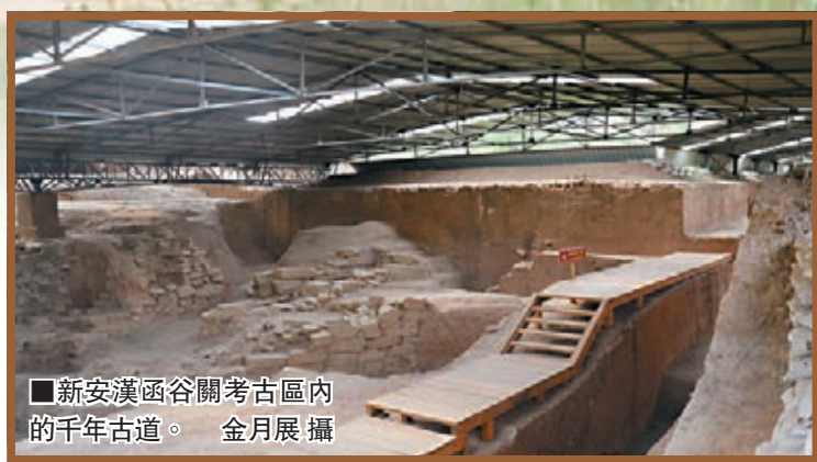
■新安漢函谷關考古區內的千年古道。