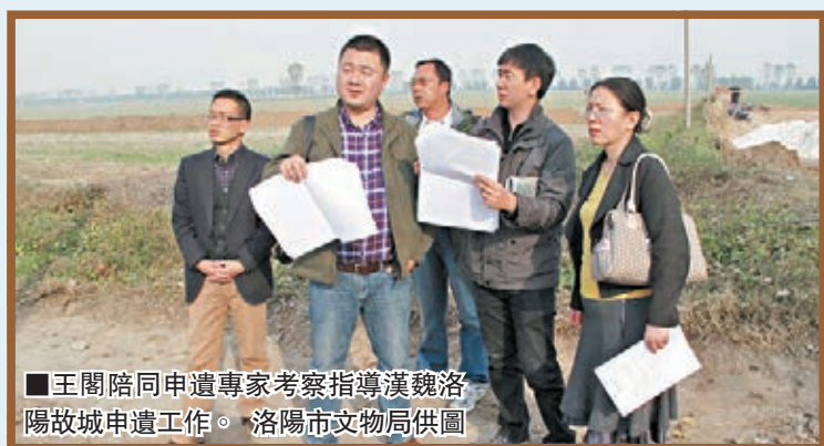
■王閣陪同申遺專家考察指導漢魏洛陽故城申遺工作。

今年6月22日，「絲綢之路」和「大運河」雙雙被列入《世界遺產名錄》，這不僅是對它們歷史功績的極大肯定，同時也喚醒了人們對它們的關注，令它們在千年之後再次贏得萬眾矚目。然而，對於世界遺產來說，申遺成功只是它們得到尊重的開始，怎樣才能令珍貴的「世界文化遺產」得到最好的保護，則是人們一直熱議，也是社會各界不斷在思考的問題。近日，記者在中國唯一承擔「雙申遺」任務的城市——洛陽，實地走訪了大運河沿線重要的糧倉遺址，絲綢之路申遺點漢魏洛陽故城遺址、新安漢函谷關遺址、隋唐洛陽城定鼎門遺址等地，探究這些遺址在申遺之後如何保護的同時，也希望給遺產保護界帶來一些冷思考。