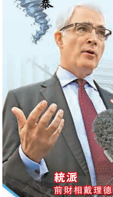
統派 前財相戴理德

英國蘇格蘭公投近日的多個民調顯示，「統派」和「獨派」支持率非常接近，勝負難料。鼓吹獨立的蘇格蘭民族黨(SNP)的支持者計劃在公投當天遊行到票站，其間吹奏蘇格蘭風笛，企圖製造聲勢逼選民投贊成票，但外界質疑此舉形同恐嚇。SNP副黨魁更揚言，若英國企業繼續支持統一，待蘇格蘭獨立後將把企業資產「國有化」。