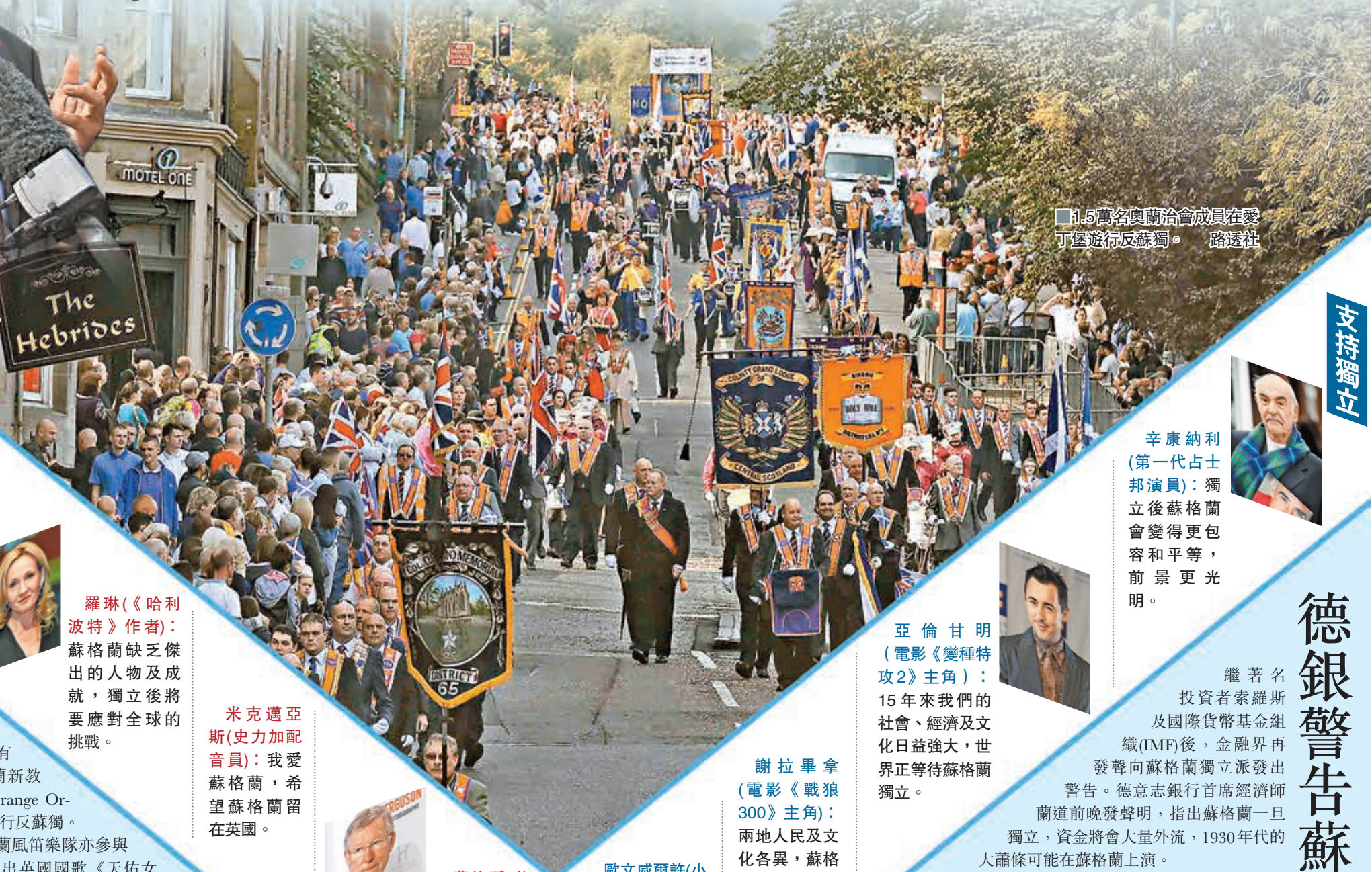
1.5萬名奧蘭治會成員在愛丁堡遊行反蘇獨。