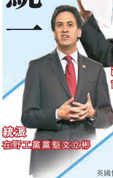
統派 前英機自高敦