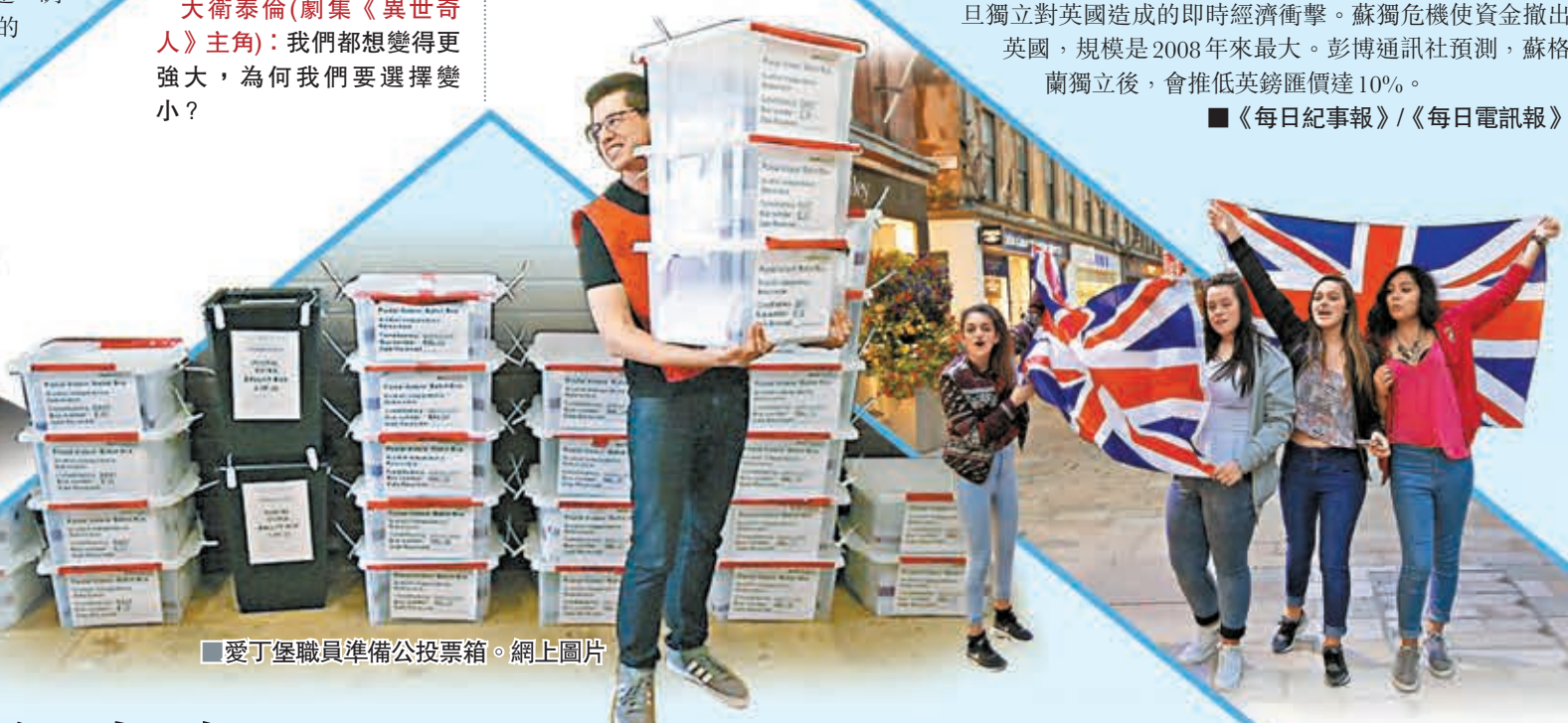
愛丁堡職員準備公投票箱。網上圖片