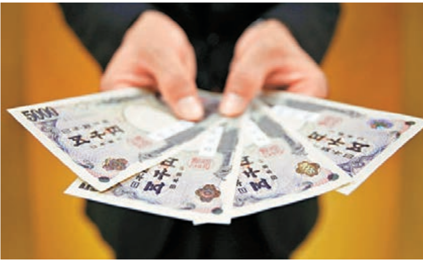
圖為日圓鈔票。 資料圖片

周四紐約12月期金收報1,239美元，較上日下跌6.30美元。現貨金價本月初受1,271美元附近阻力後持續下跌，一度於本周五反覆下挫至1,232美元附近7個多月低位。美國10年期長債息率反覆攀升至2.56%，導致投資者近日傾向沽售黃金，令金價有進一步下行風險。美國聯儲局將於下月結束買債，歐洲央行將推行新一輪的寬鬆措施規模，均有助美元轉強，不利金價表現。預料現貨金價將反覆走低至1,220美元水平。