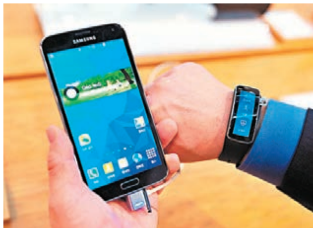
韓股出口表現備受看好，吸引資金流入股市。圖為韓國手機三星S5。 資料圖片

上述基金的資產地區分佈為25.17%香港、19.56%韓國、15.47%台灣、13.13%中國、311.61%印度、3.55%其他地區、3.46%越南、3.3%泰國、2.74%印尼及2.02%巴基斯坦。相關