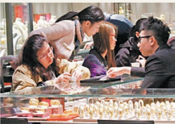
圖為顧客在珠寶金舖選購貨品。 資料圖片

此外，第四季為傳統旅遊旺季，在美國經濟逐漸回溫，家庭消費逐漸增加之際，加上持續寬鬆的貨幣政策將會拉抬歐洲區經濟復甦力道，第四季精品業績表現可望呈現大幅成長。因此在佈局上，投資者不妨把握階段相對低點的機會進場布局，以定期定額的方式擇優佈局精品或消費類基金，積極參與每年季節性的投資機會。