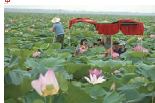
■ 岳陽君山團湖賞荷園

形式，在中國古代建築史上也是獨一無二的。 而在去岳陽樓不足四十公里的君山野生荷花世界——原岳陽團湖公園，以其種植荷花面積6000多畝，成為目前亞洲地區已知面積最大的野生荷花集羣地，2009年還榮獲國家林業局授予的「中國野生荷花之鄉」的榮譽稱號。 君山野生荷花世界現被納入洞庭湖水禽棲息地保護項目、野生蓮保護項目和東洞庭湖濕地公園。2010年8月8日、2011年7月8日第二、第三屆中國（岳陽）野生荷花旅遊節均在此隆重舉行。 再移步洞庭湖西畔，「桃花源裡的城市」——千年古城常德，坐擁「中國城市第一湖」美稱的柳葉湖，余秋雨先生曾讚譽「常德有個柳葉湖，是常德人的一種奢侈」。這裡正躊躇滿志做好「柳葉湖「水文章」」，「親水、秀水、游水」是這篇文章的主題，以水養魚人們習以為常，而「以魚養水」則新穎獨特，常德就打算獨闢蹊徑，以其他城市稀缺的