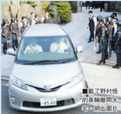
載了野村悟的車輛離開大宅。