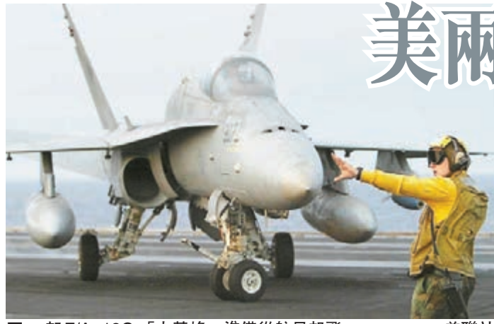
一架F/A-18C「大黃蜂」準備從航母起飛。