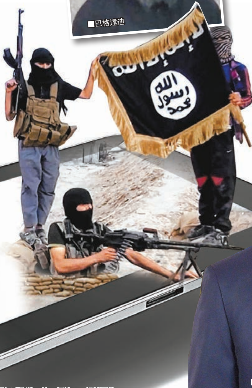
ISIL企圖把「聖戰」擴至網絡。設計圖片