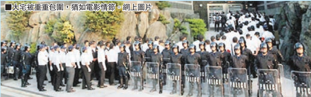
大宅被重重包圍，猶如電影情節。