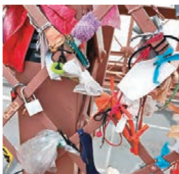
■安全套「入侵」大橋。網上圖片

美國紐約布魯克林大橋遭「愛情 鎖」佔多時，不過近日大橋上被人 掛上了其他物品，包括膠袋、奶嘴、 胸圍、衛生棉條，甚至安全套等，有 居民大嘆遊客欠公德心，破壞景觀。