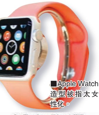
■ Apple Watch 造型被指太 女性化。

Apple Watch 外觀亦備受爭 議，法國奢侈品牌 LVMH 的手錶 部門負責人批評，Watch 造型 不性感，太女性化，且與市面 其他智能手錶過於相似，形容 產品是「設計初學者作品」。另 外，彭博分析認為，Apple Watch 將影響瑞士錶業，中低 價手錶首當其衝，如 Swatch 及天梭的 T-Touch Expert Solar 錶。鐘錶業人士則認為價格介乎 500 歐元至 1,500 歐元的錶可 能會受壓。