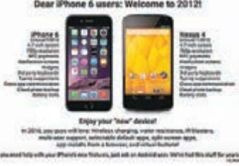
■網民製作「歡迎來到2012年」 的圖片嘲諷 iPhone 6。