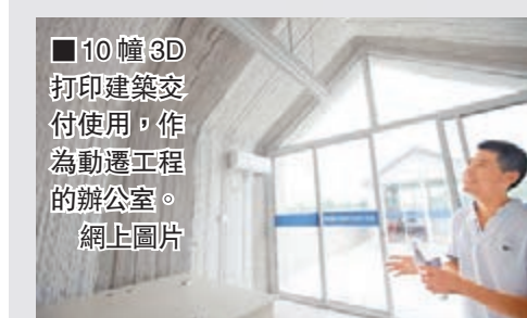
■10幢3D打印建築交付使用，作為動遷工程的辦公室。 網上圖片