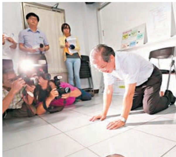
■葉文祥在記者會下跪道歉。

香港文匯報訊 據東森新聞報導，無黨籍台北市長參選人柯文哲日前公布自競選專戶成立近3個月來，共花費約新台幣1200萬(約310萬港元)競選經費，並呼籲對手、國民黨台北市長參選人連勝文公佈選舉費用。對此，連勝文競選總幹事蔡正元昨日說：「我個人不相信柯文哲的賬目，他是一個賬目不清的慣犯，不會隨着這慣犯起飛」。蔡正元又指，柯文哲在台大醫院任職時賬目不清，被列為是申報不實的嫌疑犯調查，屬於重度犯案紀錄者。