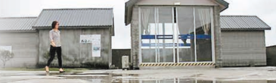
■10幢屋的建築僅花了24小時。

3D打印技術越來越完善，在上海青浦張江高新園區內10幢3D打印建築正式交付使用，作為當地動遷工程的辦公室。這些「打印」出來的建築牆體是用建築廢料製成的特殊「油墨」，按照電腦設計的圖紙和方案，經一台大型的3D打印機層層疊加噴繪而成，10幢小屋的建築僅花了24小時。這項被認為是21世紀最熱門的技術，在建築領域有了新的應用例子，不過，3D打印行業專家對此表示謹慎樂觀。 ■綜合報導