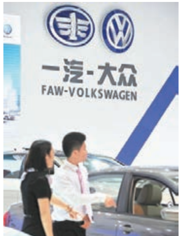
■一汽-大眾公司因壟斷被罰款2.4858億元人民幣。

據了解,自2013年初以來,內地已開出6張上億元的反壟斷罰單,罰金總計近30億元。對於近期中國反壟斷不斷擴圍,專家分析指,中國反壟斷正進入新常態,未來反壟斷執法會更加頻繁。