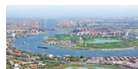
■300萬平方米的綠色長廊環繞着中心商務區。

香港文匯報訊 隨着天津濱海藍鯨島綠化工程、彩帶島公園景觀綠化提升工程的陸續完工,中心商務區內綠化面積目前達300餘萬平方米。中心商務區通過對海河兩岸地形地貌整形、苗木灌木種植及景觀設計,海河沿岸形成一條蜿蜒曲折的景觀長廊,同時也成為了濱海新區特有的城市景觀片區和天然氧吧。