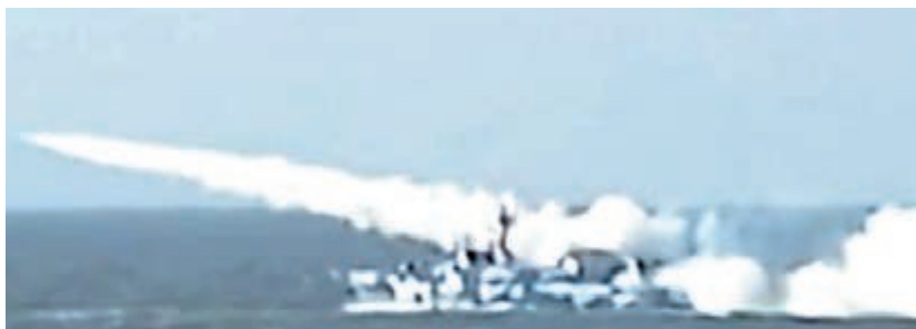
■國產飛航式反艦導彈國外打靶畫面曝光。

香港文匯報訊 中央電視台昨日曝光國產飛航式反艦導彈打靶畫面。據報道,該新銳導彈全重只有一噸左右,卻能打擊上百公里外的目標,一下就擊沉或重創三千噸級戰艦。它的戰鬥特點,是穿甲爆炸,它先穿進去,然後在軍艦內部爆炸,所以殺傷效果很好。