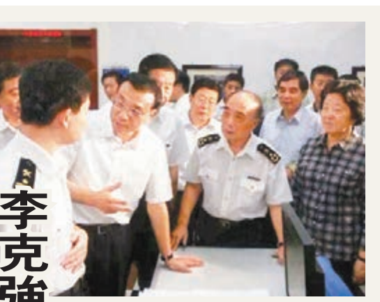
■李克強在孫春蘭(右一)、黃興國(右三)和李佩林(右二)陪同下考察天津海關。

「國有化」釣魚島兩周年,日方稱將組建釣魚島警備隊,華春瑩表示,釣魚島及其附屬島嶼是中國的固有領土。中國政府有信心、有能力維護國家領土主權。我們要求日方停止一切損害中國領土主權的行為,以實際行動糾正錯誤。