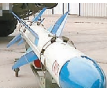
■國產飛航式反艦導彈。

據中通社報道,其中兩款新型飛航式反艦導彈C802A和C602,彈體設計類似飛機。中國航天科工集團公司導彈專家關世義稱,這種導彈最重要的特點就是在空層裡面飛行,所以要利用空氣動力,它除了這個機(彈)翼產生升力以外,彈身也可以產生升力,但主要是靠機翼。