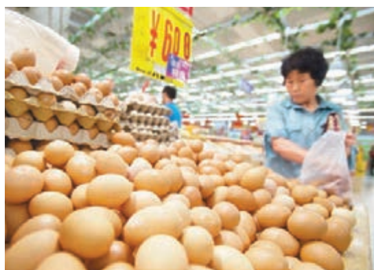
雞蛋及鮮果價格上月同升。

未來一周,規模以上工業增加值、城鎮固定資產投資和社會消費品零售總額等宏觀數據將逐一公佈。多家機構估計,在需求不旺的背景,包括固定資產投資和工業增加值在內的一系列經濟數據恐怕也難強於7月。雖然出口數據相對理想,但拉動經濟增長的其他兩駕馬車投資和消費在短時間內卻難有超預期表現。