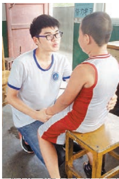
鄭大社工對留守兒童進行心理疏導。 本報河南傳真