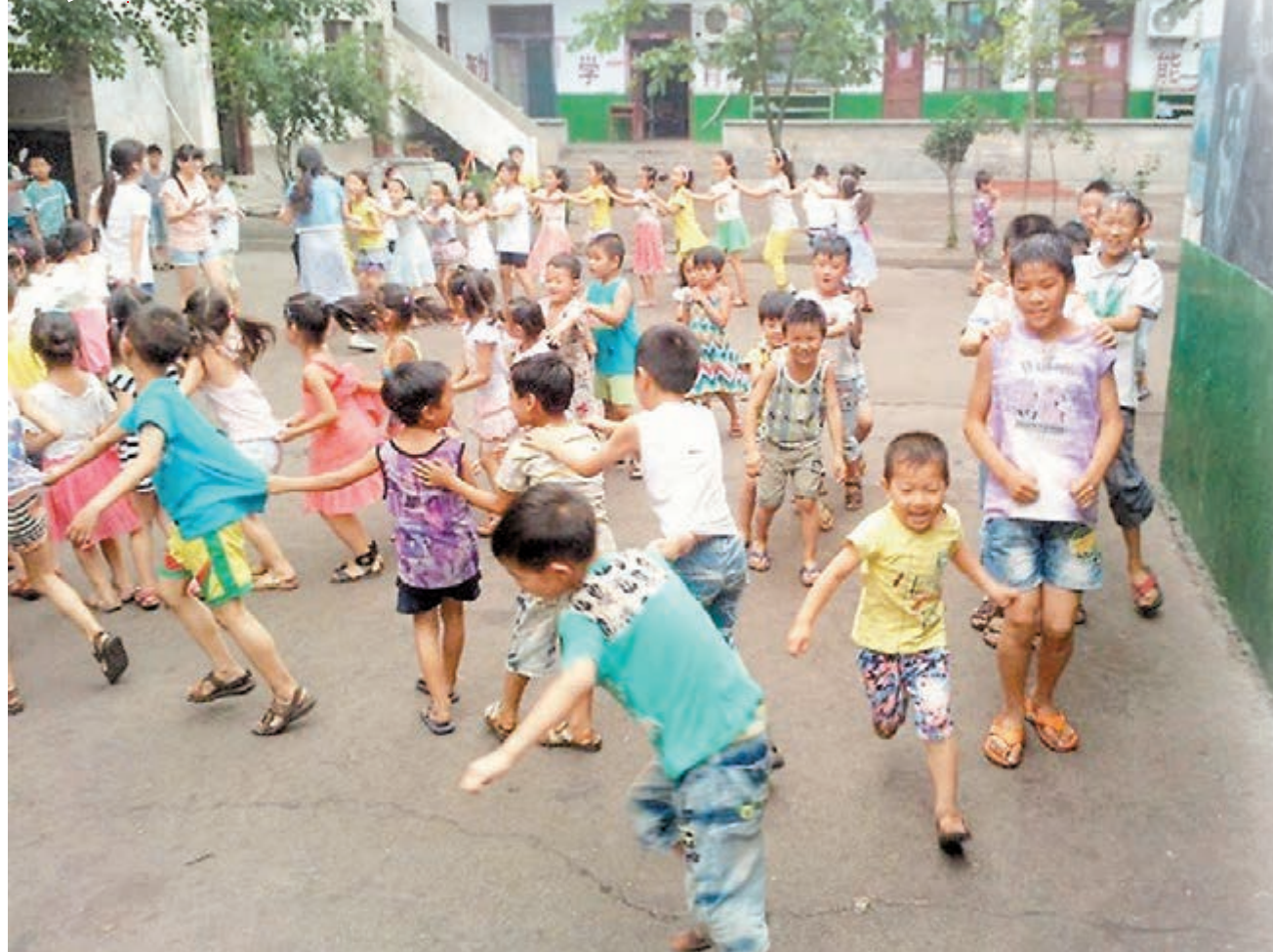
留守兒童在學校操場玩遊戲。 本報河南傳真