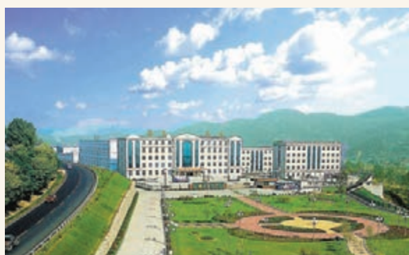
萬通藥業。 本報吉林傳真

修正、東寶、萬通、金馬、茂祥等11戶企業已經發展為集團公司，東寶、金馬等5戶企業獨立上市，位居國內地級上市醫藥企業首位，通化醫藥產業集群被評為「中國百佳產業集群」。