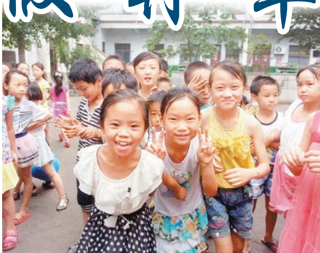
在託管中心生活的留守兒童。