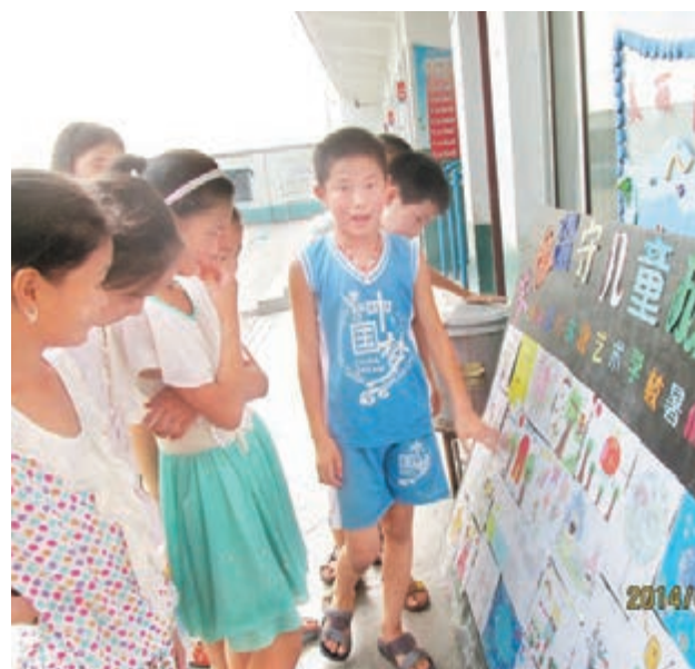
留守兒童在學校裡觀看畫展。