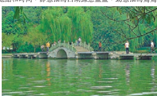
張炎以動態描寫西湖水波粼粼的畫面。

2. 接葉巢鶯，平波卷絮，斷橋斜日歸船。（《高陽台·西湖春感》）直接點明地點和時間，靜態描寫西湖綠意盈盈，動態描寫鶯鶯