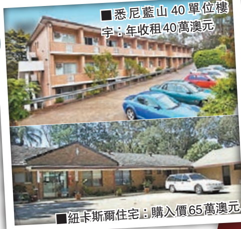
悉尼藍山40單位樓宇，年收租40萬澳元