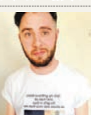
衫上印了兩人的4張合照。

男友孤身外遊，女友自然擔心對方拈花惹草。英國女子巴特利特為了避免男友受「騷擾」，特別製作了一件印着兩人「愛情印記」的T恤送給他。男友穿上後拍照放上網，令網民議論紛紛。