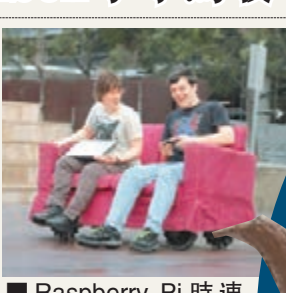
Raspberry Pi時速15公里。

整天窩在梳化上已是懶惰無比，澳洲9名工程學系大學生將之發揮至極致，打造出擁有梳化外形、時速15公里的Raspberry Pi電腦，依靠車輪驅動行駛，並使用Xbox遊戲機手掣控制，令懶人可坐着梳化到處去。