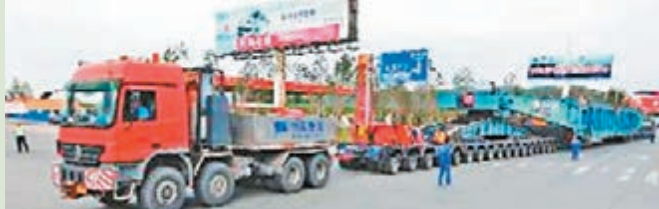
巨無霸大貨車。本報吉林傳真

吉林 一輛「巨無霸」大貨車日前來到吉林市。該車全長約108米，共有292個車輪。車貨總重約243噸。這台「巨無霸」是一輛橋式車組，可以分成5個部分。其中，車頭和車尾都是主車，各有14個車輪。前車板由17排車組構成，後車板有16排，每排車組有8個車輪。