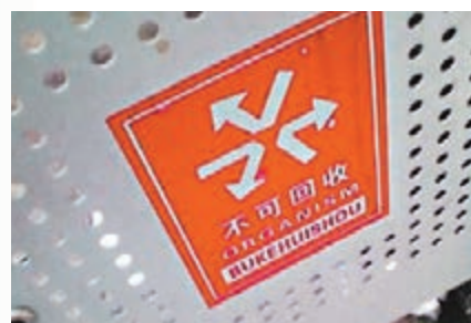
垃圾桶上中文標識為「不可回收」(應為「UNRECYCLABLE」)，英文標識為「ORGANISM」，大出洋相。

武漢 近日，有網友發微博指出武漢地鐵一些英語標識翻譯不當，比如地鐵4號線站台地面引導乘客上車的箭頭後面，跟着英文單詞「go on」，意為笨蛋。此處應是「go on」(往前走)，忘了加空格引起誤解。地鐵方面有關負責人表示，地鐵英文標識將統一規範。