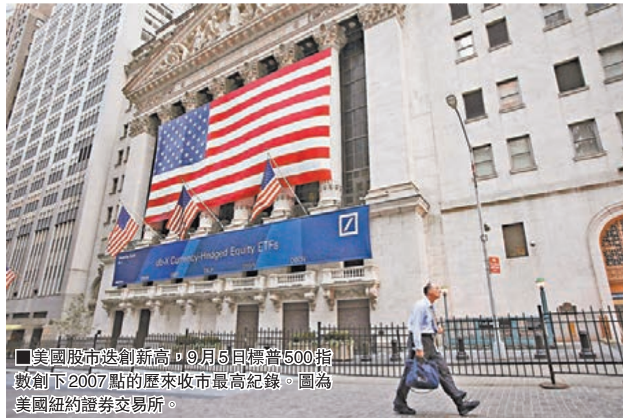
美國股市迭創新高，9月5日標普500指數創下2007點的歷史收市最高紀錄。圖為美國紐約證券交易所。

資產行業比重為32.06% 健康護理、23.78% 資訊科技、13.25% 非必需品消