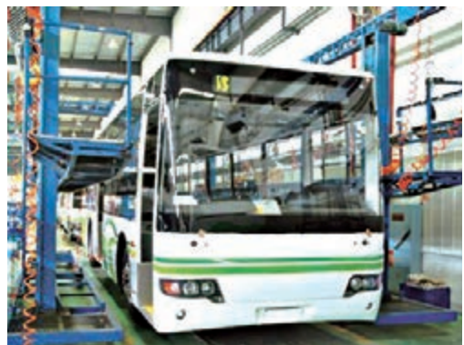
■南車時代電動汽車股份有限公司生產的混合動力客車。

在株洲市決策者們的智慧引領下，在株洲市民的全情投入中，一個「綜合實力更強、發展品質更優、創新活力更足、生態環境更美、服務效能更高、人民群眾生活更加幸福美好」的城市正在走來。