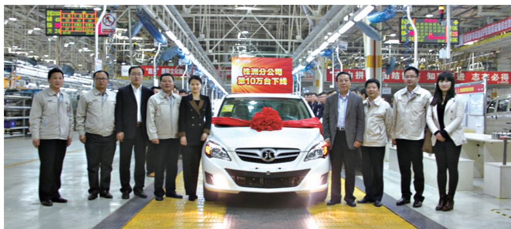
■北汽股份株洲分公司自主品牌整車。網上圖片