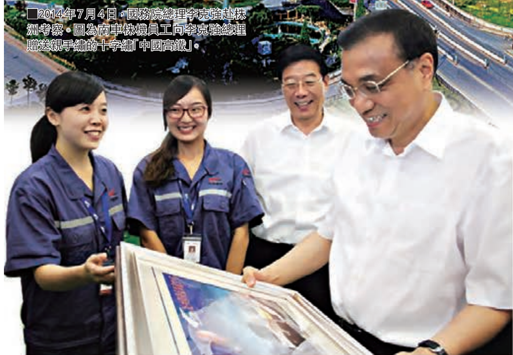
■2014年7月4日，國務院總理李克強赴株洲考察。圖為南車株機員工向李克強總理贈送親手繪的十字繡「中國高鐵」。

工業，是湖南株洲最為閃亮的城市名片。經過60多年的發展，今天的株洲，已經形成一個以軌道交通、航空、汽車及零部件、服飾、陶瓷、有色金屬新材料精深加工、新能源、中藥現代化和健康食品為主體的實力不凡的工業體系。2013年，株洲市實現規模工業總產值2664.8億元，擁有規模工業企業1347家。株洲的優勢在工業，主體在工業，壓力在工業，希望也在工業。打造株洲發展升級版，其成敗關鍵在工業先行，加快實現產業轉型、升級發展，成為株洲全市上下的共識。