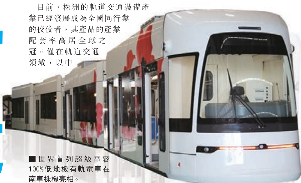
■世界首列超級電容100%低地板有軌電車在南車株機亮相。