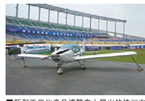
■新型工業化產品博覽會上展出的株洲本地生產的小型飛機。

與此同時，還將搶抓新能源汽車大發展機遇，大力引進新能源汽車整車及汽車零部件廠商，推進北汽二工廠等重點項目建設，加快中檔車型研發生產，完善汽車零部件配套體系，加強汽車產業文化建設，全面提升株洲汽車產業競爭力，將株洲市打造成中部地區汽車產業重點城市和國內最具影響力的新能源汽車生產及示範運營基地。力爭到2017年，汽車產業產值突破800億元。