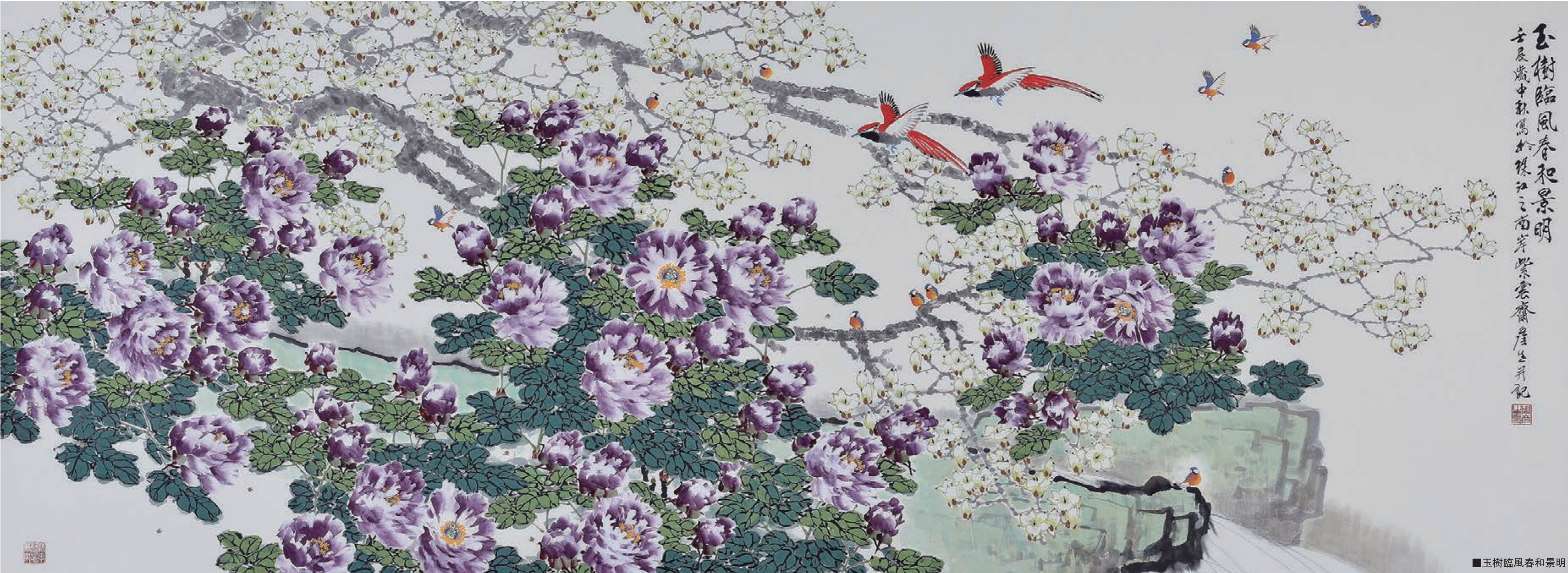
■玉樹臨風春和景明

出版有《周彥生工筆花鳥畫選》、《周彥生工筆花鳥畫小輯》、《周彥生花鳥畫集》、《周彥生畫集》、《中國當代實力派畫家—周彥生精品選》和《周彥生扇面畫藝術》、《周彥生現代工筆花鳥》、《榮寶齋畫譜—周彥生工筆花鳥》、《花語—周彥生花鳥畫作品》、《周彥生寫意花鳥作品精選》、《大家講堂—周彥生花鳥卷》、《當代逸品—周彥生卷》、《時代畫風—當代中國工筆劃二十家》等。