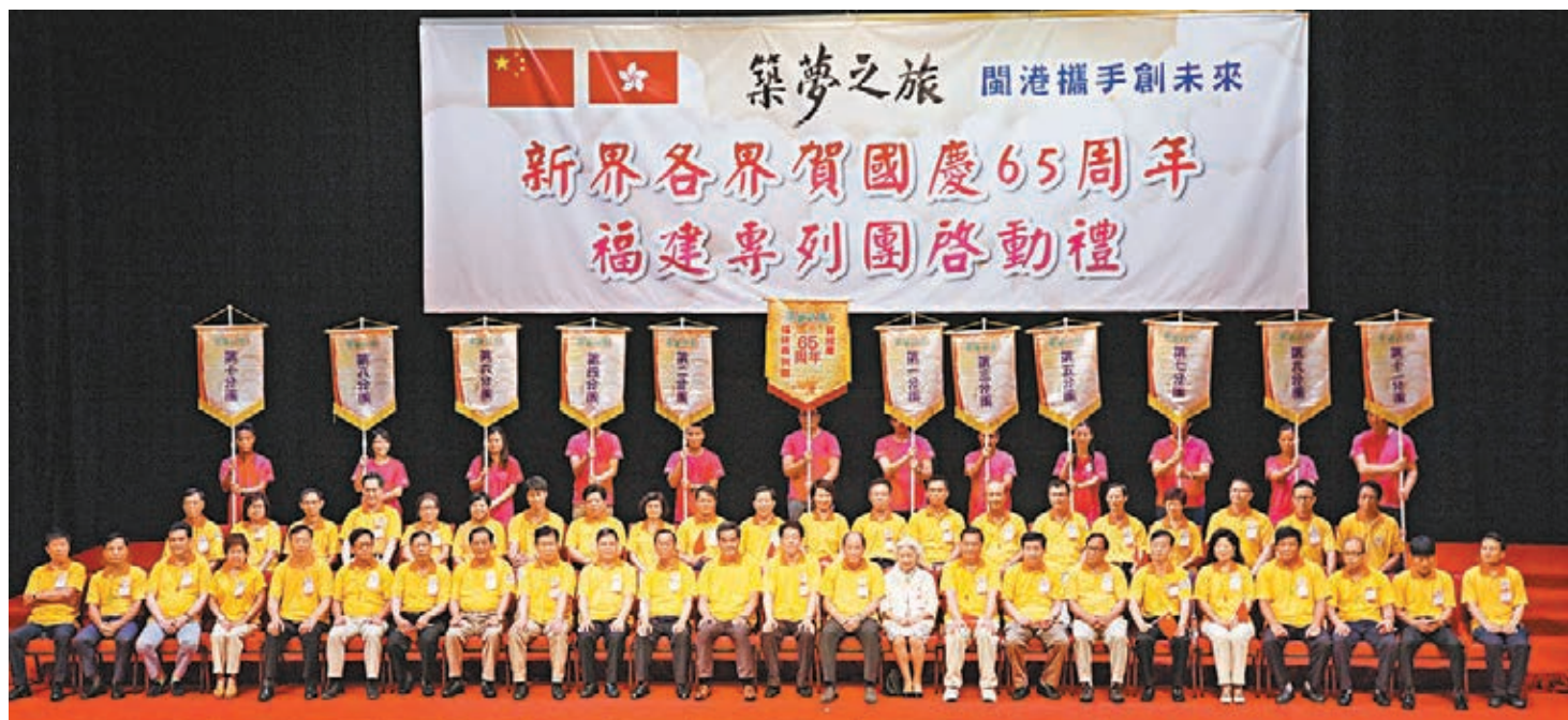
■啟動禮上，賓主合照。