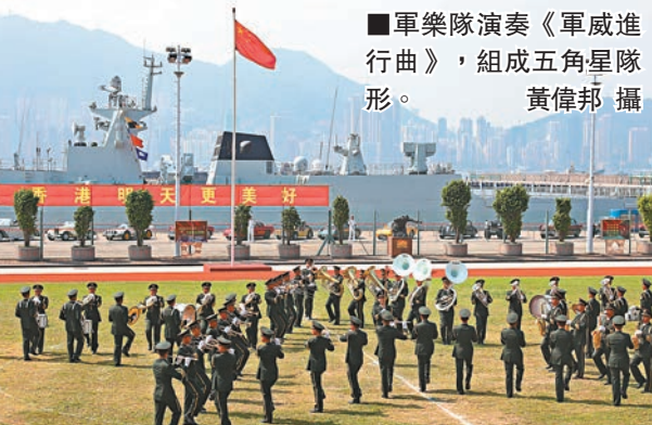
■軍樂隊演奏《軍威進行曲》，組成五角星隊形。