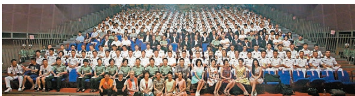
■逾300官兵與探訪團合影。