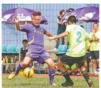
■明星足球隊與駐港部隊足球隊進行友誼賽。