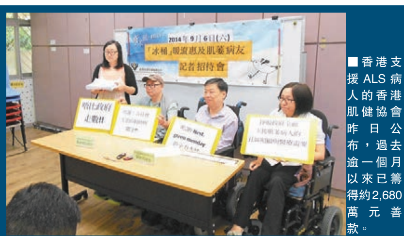
香港支援ALS病人的香港肌健協會昨日公布,過去逾一個月以來已籌得約2,680萬元善款。