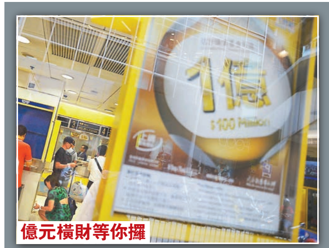
六合彩金多寶將於周二開彩。馬會預計,如頭獎一注獨中,彩金有機會高達一億元。

張建宗補充,政府現時共聘用約3,400位殘疾公務員,殘疾僱員佔整體公務員人數約2%,政府將會繼續推廣《約章》計劃,鼓勵各行各業僱主以行動支持殘疾人士就業。勞福局昨日亦與香港電台合辦「能者舞台仲夏日」綜藝表演,由本港藝人連同來自世界各地的殘疾人士共同演繹舞台劇,以體現社會傷健共融。