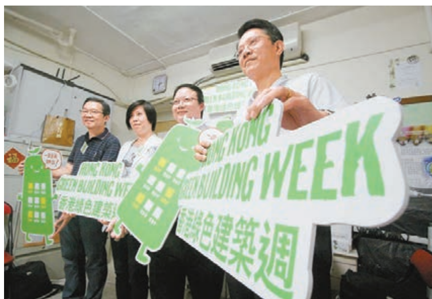
▲第二屆「香港綠色建築週」為20個基層戶免費安裝節能的家居設施。

香港文匯報訊(記者 鮑曼珊)基層家庭生活困苦,所有日常支出亦要「計過度過」。日前開展的第二屆「香港綠色建築週」,昨日為20個基層住戶免費安裝節能的家居設施,包括LED光管、節水花灑及節水器,每戶成本約1,000元,預計有關設施可為每戶平均每年節省210元電費及106元水費與排污費。有受惠戶表示滿意,認為「有節水功能的花灑較好用」。