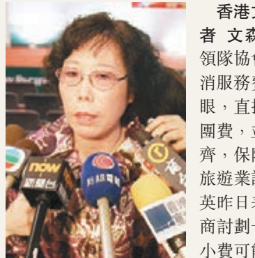
香港文匯報訊(記者 文森)香港外遊領隊協會早前建議取消服務費「建議」字眼,直接將小費納入團費,並於報團時收齊,保障領隊收入。旅遊業議會主席胡兆英昨日表示,旅行社商討劃一領隊及導遊小費可能會違反日後實施的「競爭法」,強調旅議會會待當局公布執法指引後才決定新方案,不排除直接撤銷建議小費的指引。胡兆英又說,雖然旅議會建議業界在旅遊巴士,以及零售店舖加裝「天眼」,但因為私隱等問題,相信推動有困難。

胡兆英昨日在一個電台節目上表示,旅行社一起商討劃一領隊及導遊小費可能會違反日後實施的「競爭法」,因為旅行社坐下來議定一個價格,已抵觸「密謀定價」的原則。他說,當競爭事務委員會正式公布指引後,旅議會會實際研究條例,希望在短時間內將建議小費的指引清晰化,甚至有可能撤銷有關指引。