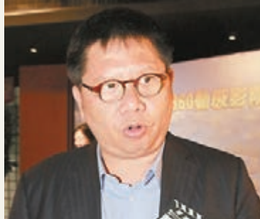
胡兆英昨日表示,旅行社商討劃一領隊及導遊小費可能會違反日後實施的「競爭法」。資料圖片