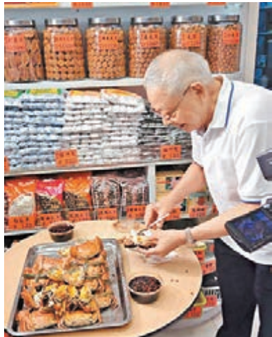
■店舖老闆即場拆蟹驗貨,表示今年氣候溫和,加上內地近年嚴打貪風,所以大閘蟹供應數量增加。