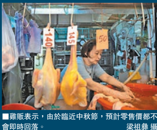
■雞販表示,由於臨近中秋節,預計零售價都不會即時回落。梁祖彝攝

◀內地活雞昨日恢復供港,首批約6,800隻中午駛進批發市場,預計最快今天應市。梁祖彝攝