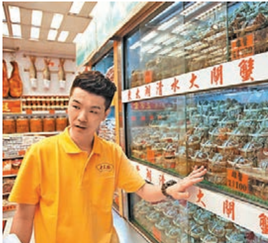
■梁先生說,今年來貨的大閘蟹質量俱佳,差不多每隻都「爆膏」,而且售價則較去年便宜20%。

「老三陽」職員梁先生亦表示,今年來貨的大閘蟹質量俱佳,差不多每隻都「爆膏」,售價則較去年便宜20%,每隻大閘蟹價格由40元至300元不等,重量則由3兩至7兩。他指,5兩重的大閘蟹較多人購買,每隻約140元。他稱,農曆9月最好是吃雄蟹,而農曆10月則最好吃雌蟹。他預計,逢周末、日是市民購買大閘蟹的高峰期。此外,首批陽澄湖大閘蟹預計於本月25日抵港,屆時約有百多籠,尚未定價。