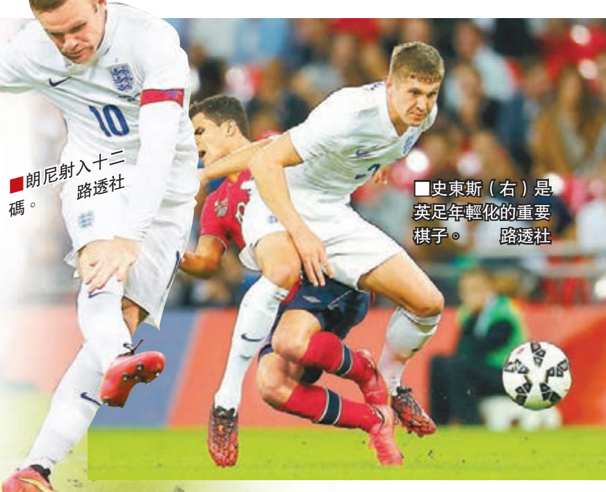
朗尼射入十二碼。