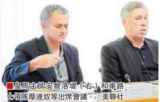
皇馬主帥安察洛堤(右)和車路士領隊摩連奴等出席會議。

歐洲足球協會主席柏天尼昨於瑞士尼翁總部召開球會領隊/教練峰會，前曼聯傳奇領隊費格遜以歐足協教練大使身份列席，被拍到與阿仙奴領隊雲加和曼城主帥柏歷堅尼有說有笑，車路士和拜仁慕尼黑教頭摩連奴與哥迪奧拿也是焦點，但曼聯領隊雲高爾因無緣今屆歐洲賽而沒獲邀出席。