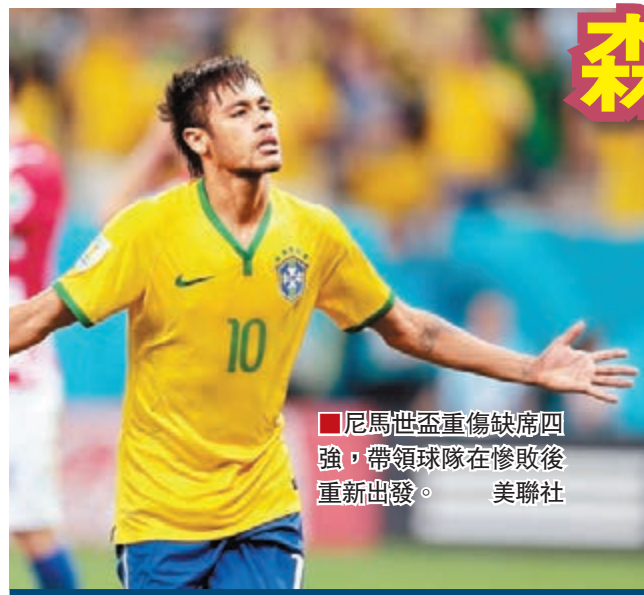
尼馬世盃重傷缺席四強，帶領球隊在慘敗後重新出發。