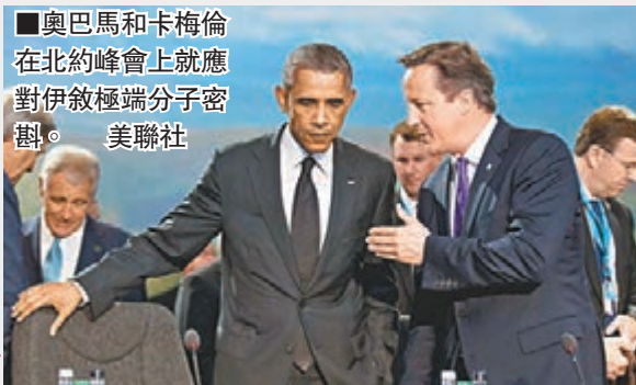
■奧巴馬和卡梅倫在北約峰會上就應對伊極端分子密商。

極端組織「伊拉克和黎凡特伊斯蘭國」(ISIL)日前處決第二名美國記者索特洛夫，並威脅殺害英國人質海恩斯，令歐美決定加強對付聖戰分子。美國總統奧巴馬則呼籲國際聯手對抗極端分子。美國防長哈格爾前日披露，超過100名美國人正在中東為ISIL效力，對美國國土安全是重大威脅。美國《星條旗報》則引述不具名美國情報官員指，加入ISIL的美國公民可能達300人，西方國家公民人數更可能達數千人。