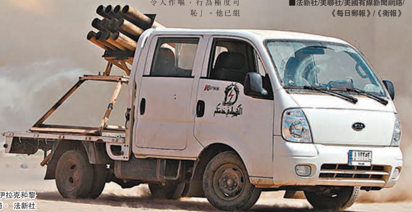
■伊拉克什葉派武裝人員向「伊拉克和黎凡特伊斯蘭國」根據地發射火箭。