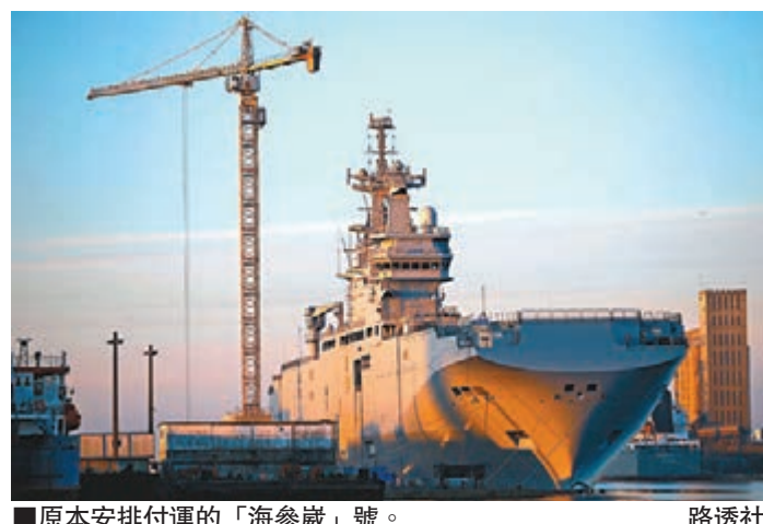
■原本安排付運的「海參崴」號。