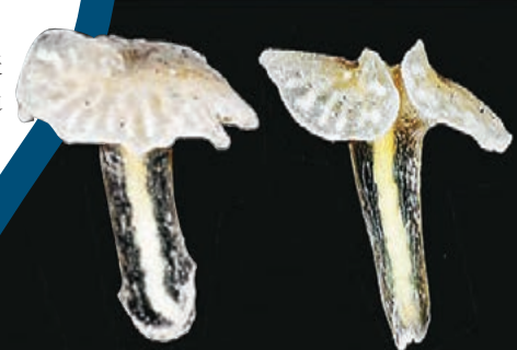
「蘑菇怪」主要有外皮和胃部。網上圖片

科學家在澳洲深海有驚人發現，有兩種外形猶如蘑菇的古怪生物，無法歸納在現有生物類別中，相信牠們或與6億年前一種已絕種生物有關。