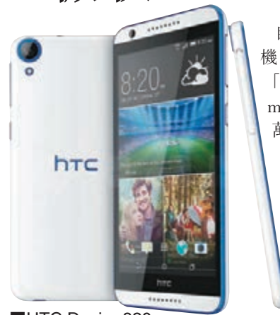
HTC Desire 820

自拍熱潮席捲全球，微軟和宏達電(HTC)看準商機，昨日不約而同在德國柏林消費電子展上發表「自拍專用」手機。其中微軟一諾基亞推出 Lumia 730 和 735 兩款機，前置鏡頭像素高達500萬，兼內置自拍濾鏡軟件，讓用戶隨時拍出高質自拍照。 Lumia 730 和 735 均配備4.7吋屏幕，670萬像素後置鏡頭，自拍輔助程式(app)會在用戶使用後置鏡頭時，透過面部識別軟件提醒用戶將手機放在適當位置。兩部手機分別售199和219歐元(約2,009和2,211港元)。 HTC 則發表其首部64位元 Android 手機 Desire 820，配備5.5吋屏幕及800萬像素前置鏡頭。拍照軟件設有「現場化妝」模式，可以調節用戶膚色；售價329歐元(約3,322港元)。