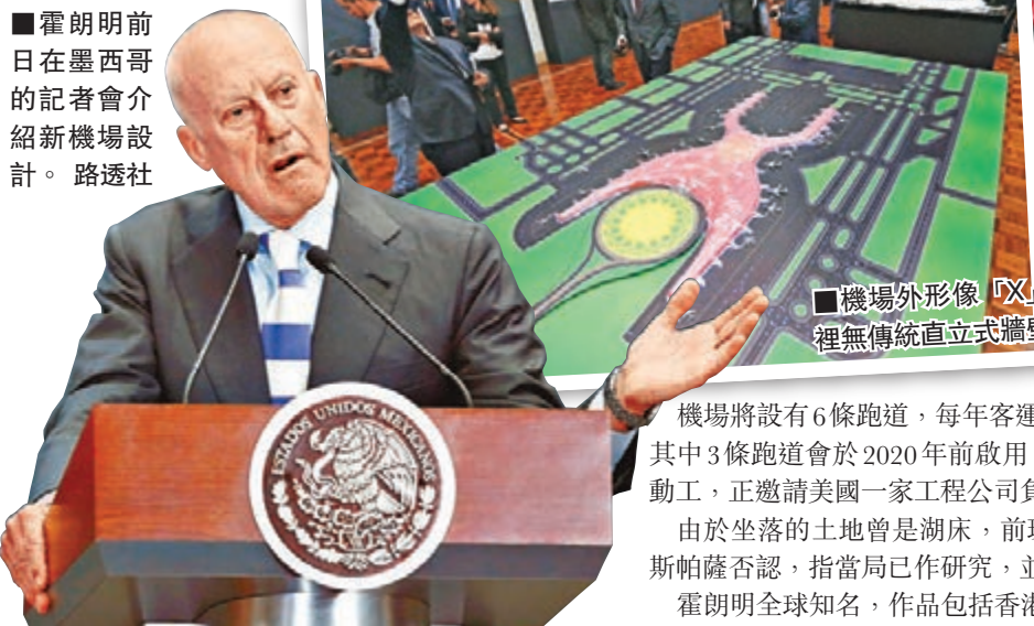
霍朗明前日在墨西哥的記者會介紹新機場設計。