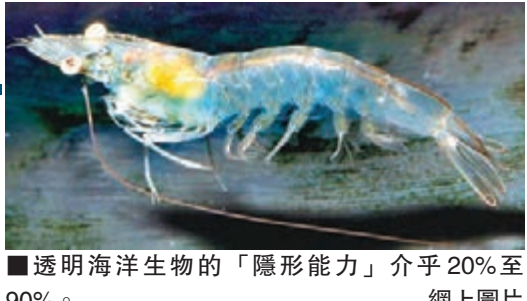
透明海洋生物的「隱形能力」介乎20%至90%。

除了水母外，還有許多海洋生物是呈半透明，包括青蛙、魚及蝦等，其實這是牠們身體的保護色。專家指，深海中但凡沒有牙齒、毒性或快速逃命能力的海洋生物，因缺乏自我保護能力，故進化能變透明的身體，融入周邊環境，避免成為獵物。牠們的「隱形能力」介乎20%至90%，視乎體積而定。