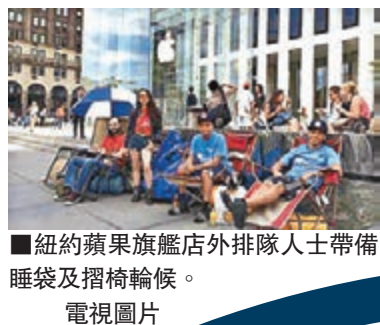
紐約蘋果旗艦店外排隊人士帶備睡袋及摺椅等候。

蘋果公司盛傳下周二推出最新款智能手機 iPhone 6，引來一眾忠實粉絲與炒家排隊等買心頭好。在美國紐約的蘋果旗艦店門外，排隊人士早有準備，帶備睡袋及摺椅等候。