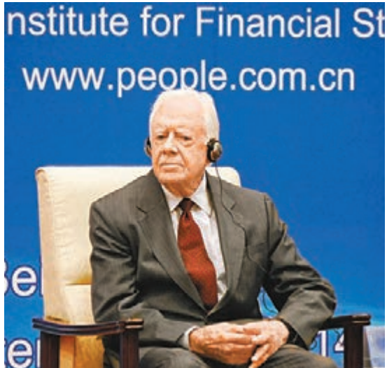
美國前總統卡特在論壇上發表演講。

據悉，本屆G20智庫論壇於3日在北京開幕，參會者包括中國、俄羅斯、美國、印度、日本、歐盟等全球主要經濟體的智庫以及來自世界銀行、IMF和聯合國的代表。