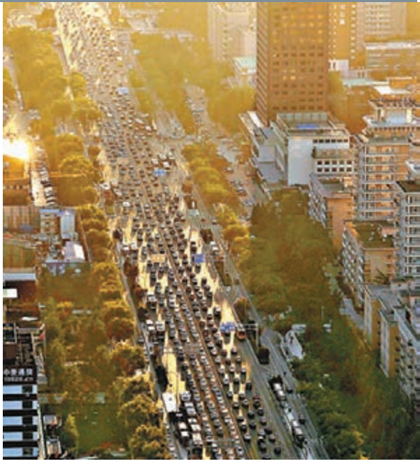
在繁忙時段，北京到處出現交通擠塞。