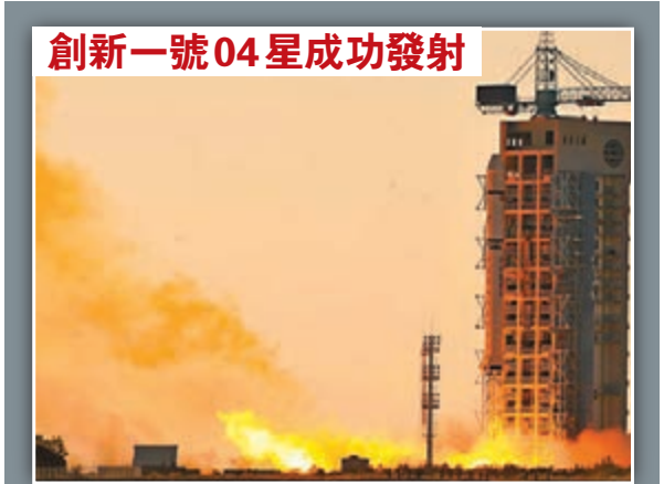
中國昨日在酒泉衛星發射中心成功發射創新一號04星，此次任務還同時搭載發射了一顆靈巧通信試驗衛星。創新一號04星由中國科學院研製，主要用於水利、水文、氣象、電力及減災等領域各類監測站點的數據採集和傳輸任務，而靈巧通信試驗衛星主要用於開展衛星多媒體通信試驗。圖為搭載創新一號04星的長征二號丁運載火箭點火升空情況。

從廣東環保廳獲悉，廣佛跨界河流、深莞茅洲河、汕揭練江、滘茂小東江的大部分河段水質均為劣V類。廣東省環保廳日前對整治污染河流訂出時間表。