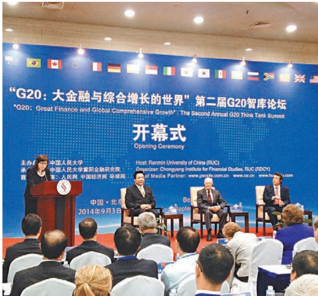
由中國人民大學主辦的G20智庫論壇在北京舉行。