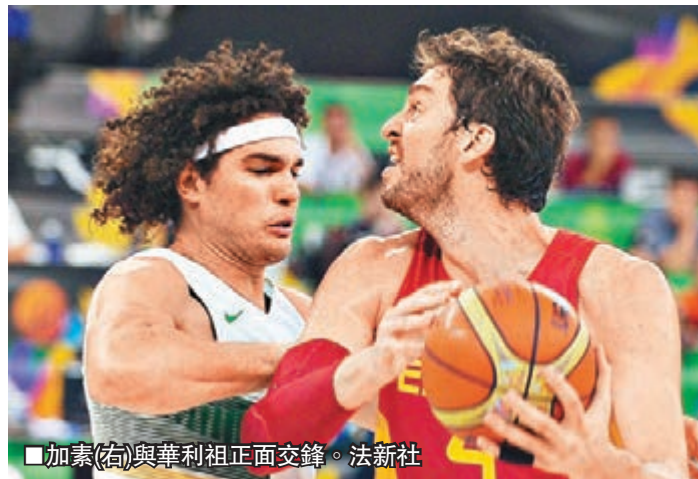
加素(右)與華利祖正面交鋒。