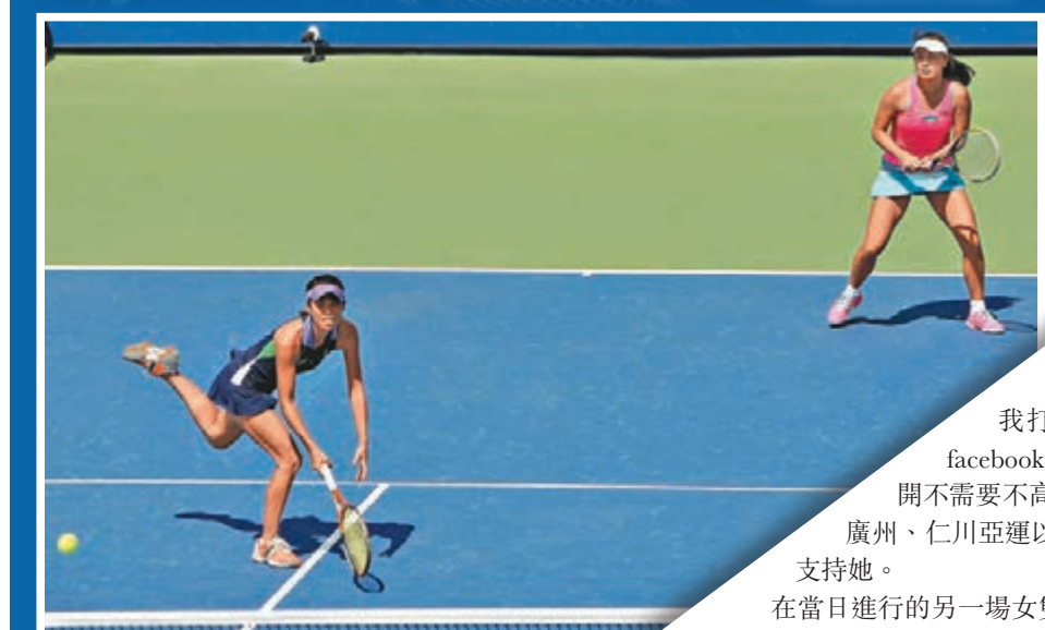
彭帥(右)與謝淑薇在女雙16強出局。資料圖片