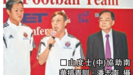
山度士(中)協助南華搞青訓。