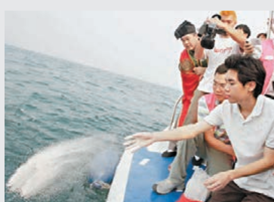
海葬儀式在港並不普遍。資料圖片

舊式唐樓、工廠大廈： 這類樓宇的租金較便宜，大幅降低經營成本，而且由於缺乏妥善管理（如未有成立業主立案法團），令經營者更易利用當中的法律灰色地帶，經營違規業務。