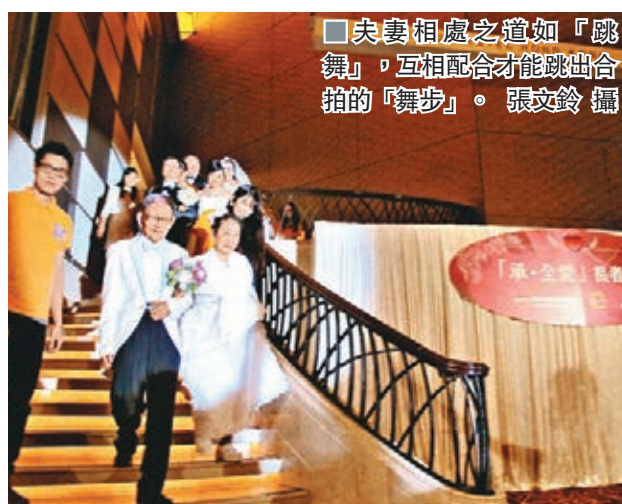
夫妻相處之道如「跳舞」,互相配合才能跳出合拍的「舞步」。

香港文匯報訊(記者 張文鈴)愛侶攜手履行半世紀的承諾,實屬不易,流行曲《天梯》歌詞不禁問道:「幾多對持續愛到幾多歲?」有機構昨日便為13對結婚逾30載的長者舉辦婚宴,一圓他們拍攝婚照的夢。一對結婚逾40載的「老夫老妻」表示,夫妻相處之道如「跳舞」,互相配合才能跳出合拍的「舞步」。他們寄語年輕夫婦,遇到問題時,心平氣和地討論和解決問題,動輒說離婚並非好事。