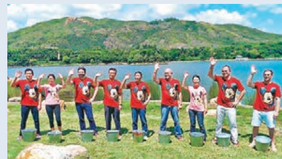
金民豪連同一班行政人員於迪欣湖「找數」接受「水桶挑戰」。

香港文匯報訊(記者 張文鈴)為表萎縮性側索硬化症(ALS)籌款的「水桶挑戰」風靡全球,早前海洋公園向香港迪士尼樂園「挑機」。香港迪士尼樂園度假區行政總裁金民豪昨日連同一班行政人員,於迪欣湖「找數」,接受「水桶挑戰」。