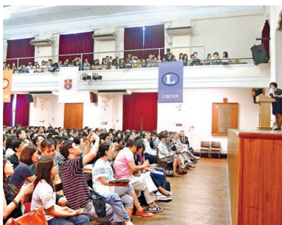
男拔附小昨日舉辦兩場入學家長簡介會,首場爆滿。

為免家長過份催谷孩子,如準備厚厚的「學習檔案」等,該校明言只收最多4張紙共8頁資料。兩場簡介會答問環節中,均有家長問及孩子證書及資料可否