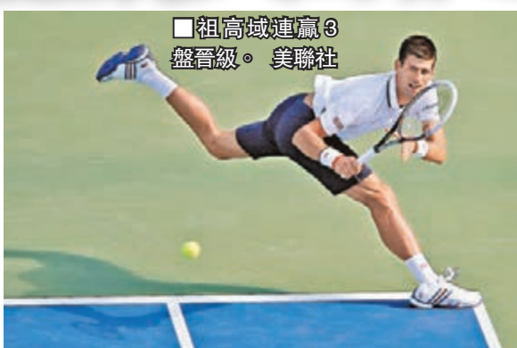
祖高域連贏3盤晉級。