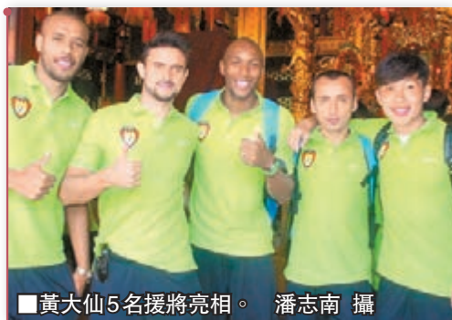
黃大仙5名援將亮相。