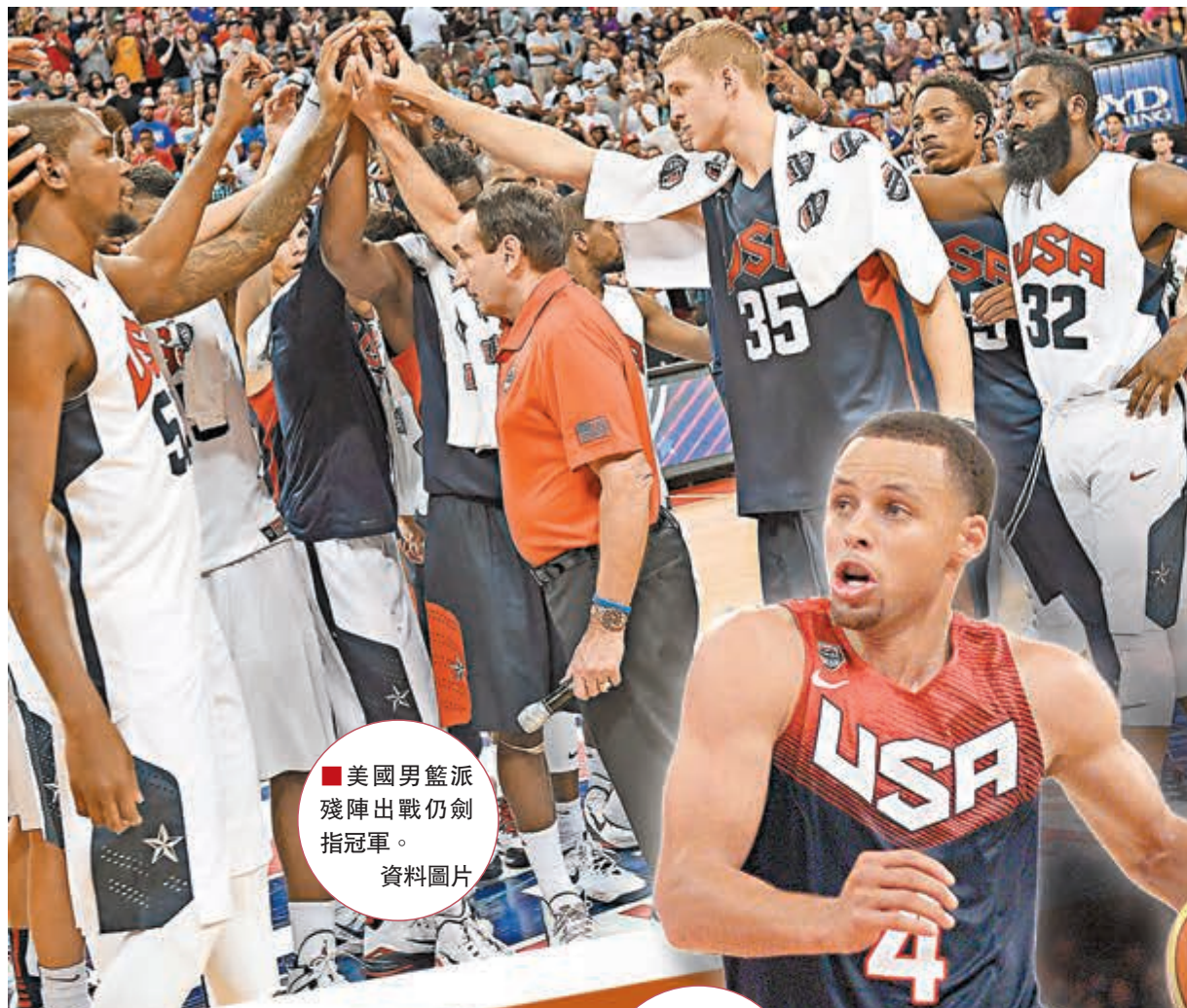
美國男籃派殘陣出戰仍劍指冠軍。資料圖片