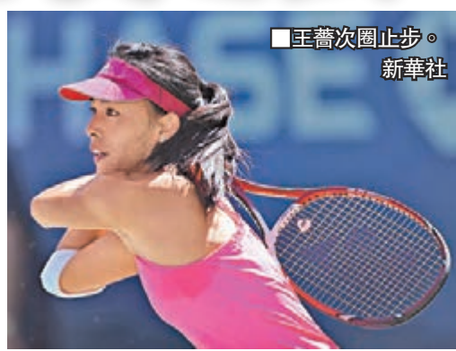
王薔次圈止步。