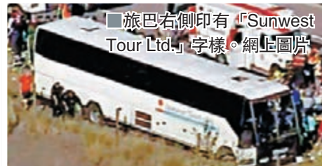
■旅遊巴士右側印有「Sunwest Tour Ltd.」字樣。