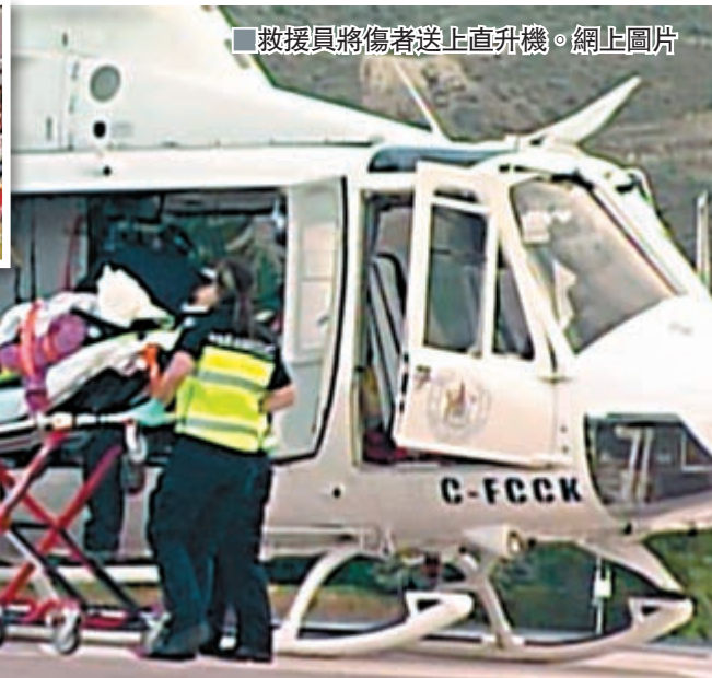
■救護員將傷者送上直升機。