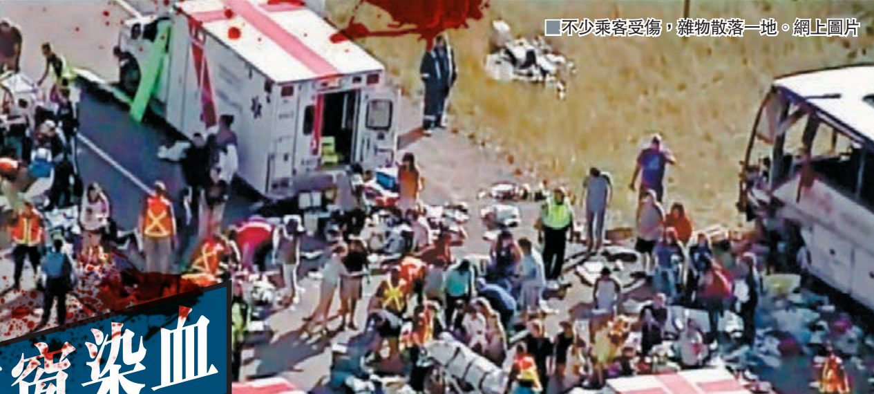
■不少乘客受傷，雜物散落一地。網上圖片