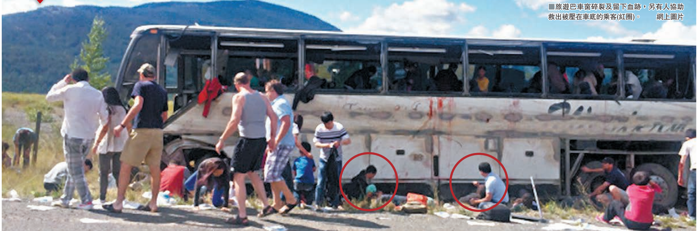
■旅遊巴士車窗碎裂及留下血跡，另有人協助救出被壓在車底的乘客(紅圈)。網上圖片