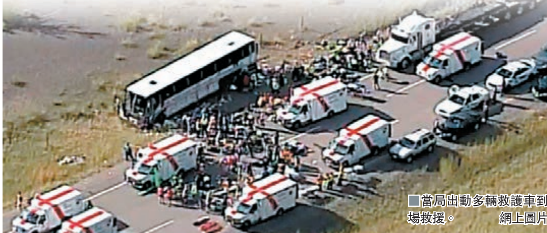
■當局出動多輛救護車到場救援。網上圖片