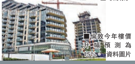
倫敦今年樓價升幅預測為15%。

整體樓市方面，報告預測到2018年英國樓市整體升幅為25.7%，略高於此前的25.2%；報告同時預測到2018年，英國房貸利率平均升至約5厘。 ■《衛報》