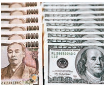
日本央行改革日圓的國際交易程序，與美元等爭長。資料圖片