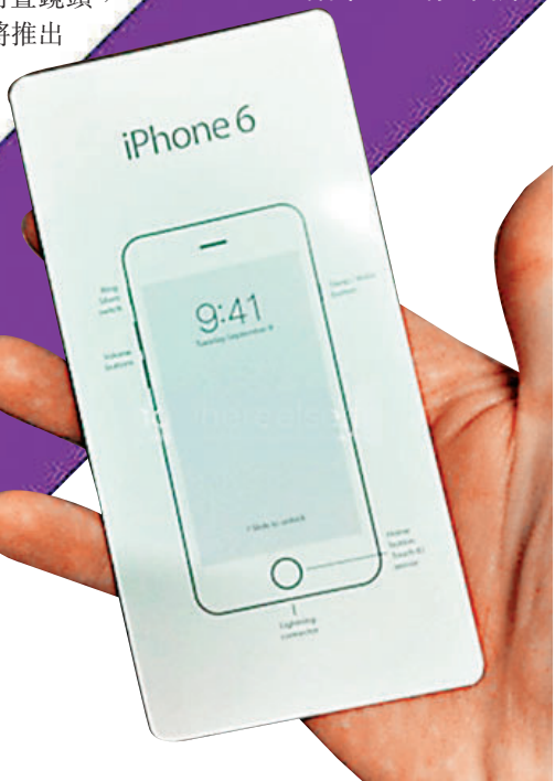
網傳包裝盒設計圖顯示音量按鈕等細節。