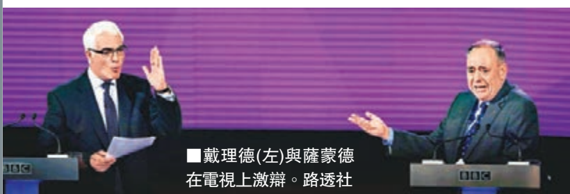
戴理德(左)與薩蒙德在電視上激辯。

距離蘇格蘭舉行獨立公投尚有約3周，支持獨立的蘇格蘭民族黨(SNP)黨魁薩蒙德，昨日與反獨立團體「一起會更好」領袖戴理德進行公投前最後一場電視辯論，兩人集中就經濟議題唇槍舌劍。辯論後民調顯示，大部分受訪者認為薩蒙德表現較佳，但民調專家認為，勝出辯論不代表能令目前支持率落後的獨立運動扭轉劣勢。