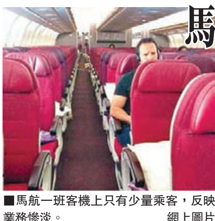
馬航一班客機上只有少量乘客，反映業務慘淡。