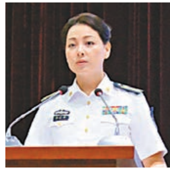
中國海軍首位女發言人邢廣梅。

香港文匯報訊 中國海軍與軍事科學院聯合舉辦的甲午戰爭120周年研討會於27日至28日在山東威海舉行。昨日下午，海軍新聞發言人邢廣梅在停泊於威海新港碼頭的海軍88船上，向媒體記者通報了此次研討會和海上祭奠儀式活動的安排和有關情況。邢廣梅是解放軍唯一的女新聞發言人，也是她在媒體前首次正式亮相。