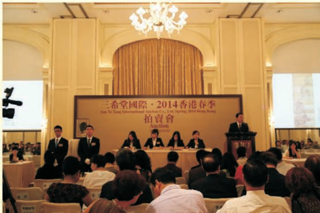
香港三希堂國際拍賣2014春季拍賣現場