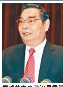
越共中央政治局委員黎鴻英。

此外，黎鴻英還可能商討中越高層互訪問題。潘金娥表示，中越之前已形成了高層定期互訪機制，國務院總理李克強就曾於2013年訪問越南。然而今年是否繼續互訪，或視黎鴻英訪華的成果而定。