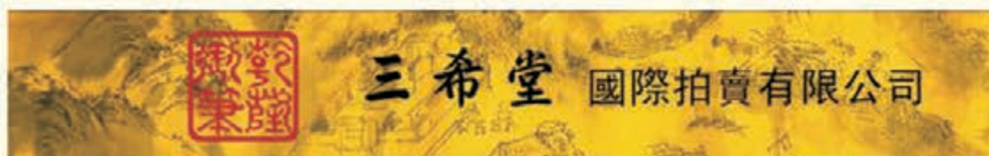
香港三希堂國際拍賣有限公司圖標

如有意托售珍藏品 歡迎聯絡各徵集處 如有諮詢事宜請來電：4008-030-335