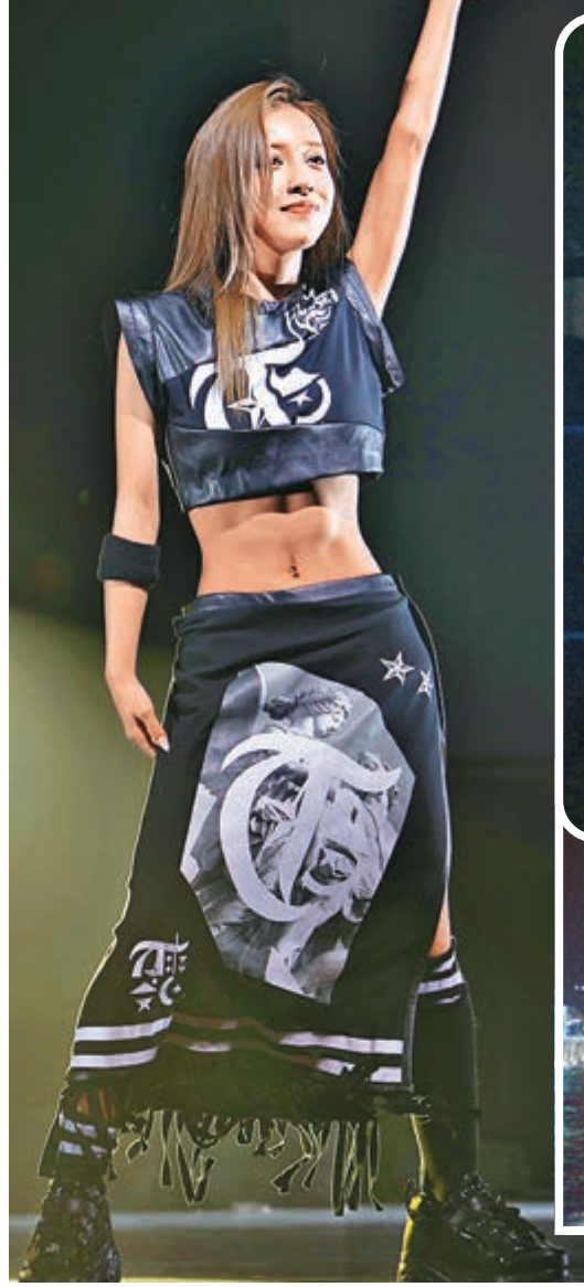
■板野友美前晚舉行首次個人香港演唱會。