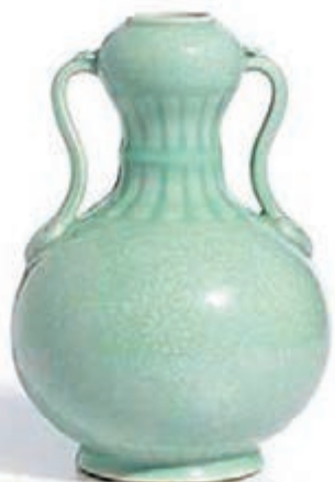
秋拍風雲 ■ 乾隆粉青釉纏枝蓮如意耳葫蘆尊

本季秋拍將於10月4至8日假會展新翼舉行的香港蘇富比，呈獻琳瑯滿目的珍稀瑰寶，涵蓋中國瓷器及工藝品、中國書畫、當代文人藝術、20世紀中國藝術、當代亞洲藝術、現代及當代東南亞藝術，以至珠寶、鐘錶及洋酒。