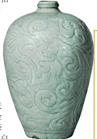
■ 南宋青白瓷卷草童子紋梅瓶