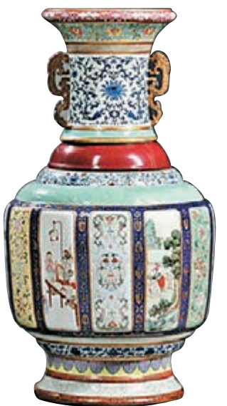
■ 「瓷母」乾隆御窯各色釉大瓶

本版自創刊以來得到了廣大讀者的歡迎和支持，現向讀者要求開闢「釋疑解難」專欄，如讀者收藏的古瓷藝術品有何疑難，可將物件拍攝成圖片電郵至：stfung@wenweipo.com，我們將有專家作解答，敬請垂注為荷。