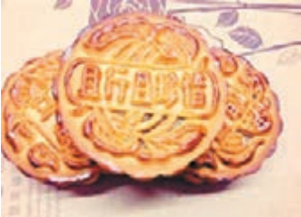
熱詞月餅「且行且珍惜」火爆市場。本報廣州傳真種定制月餅的售價基本維持在每塊15元左右。本報記者 胡若璋 廣州報道

這年頭沒點花樣還吃月餅啊,所以我就乾脆一邊吃一邊玩,反正是中秋聚會,我們順便就把月餅拿來當一回玩具。一位製作個性化月餅的網店店主告訴記者:「所謂個性化定製的關鍵是個性,不是隨便搞個半糖、弄個健康標籤就叫定制。」據悉,此