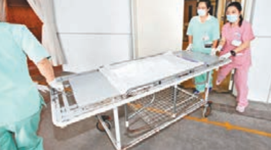
柴灣環翠邨一個月大女嬰猝死。