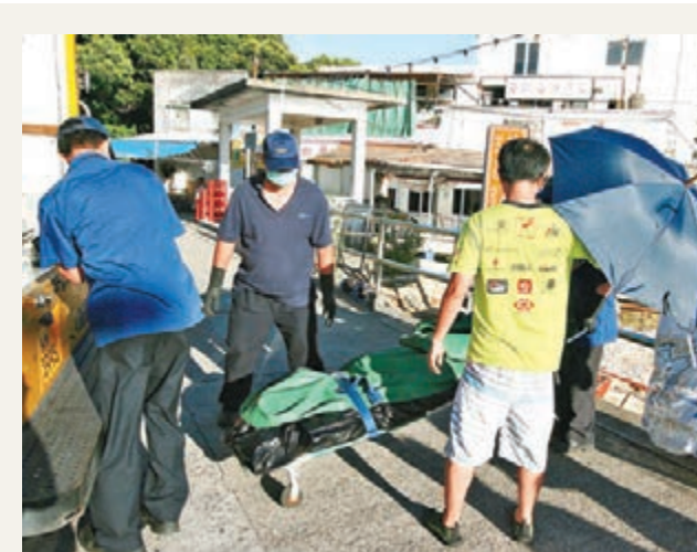
東涌老翁釣魚溺斃，家屬到場認屍。

有限公司見習維修員，昨承認損壞財產、罔顧他人生命是否會因而受到危害罪，還押至下月15日判刑，其間提取教導所及心理報告。控方引述飛機工程專家指，該些電線損毀會影響自動駕駛系統及一個衛星通訊頻道，但飛機仍可以人手操作飛行及使用其他通訊頻道，但法官要求控方向專家了解在最壞情況下會發生甚麼後果。 案發後公司花了8.6萬多元徹底檢查及修理受損電線，辯方指被告感到抱歉，獲保釋候審期間努力打工賺取每月1.5萬元用作賠償。