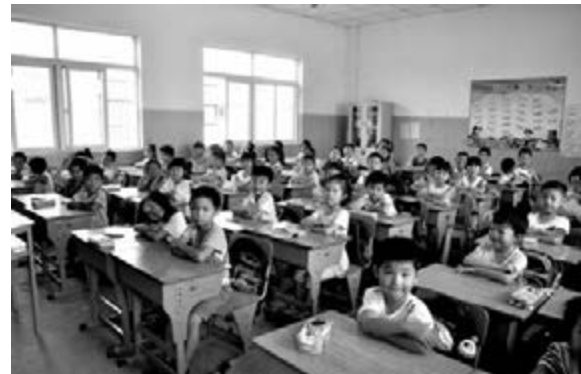
■ 大同三小學生在教室裡認真學習文化知識。

長沙市教育局局長王建華在接受本報記者採訪時介紹，在長沙城區，「長郡」、「雅禮」、「師大附中」、「砂子塘」、「大同」等「名校」託管、幫扶的中小學，至今已有了76所，佔城區所有中小學的近三成。來自長沙市教育局的統計，截至2012年