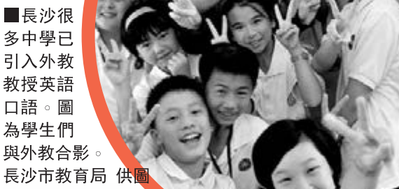
■ 長沙很多中學已引入外教教授英語口語。圖為學生們與外教合影。

記者了解到，長沙市縣兩級充分利用名師優勢，累計組建了62個名師工作室，充分發揮特級教師和骨幹教師輻射作用，以點帶面，令更多教師在名師引領下快速成長。先後選派5批共240餘名優秀中青年幹部到清華大學、華東師範大學、新加坡南洋理工大學等國內外著名高校參加研修培訓，有效優化了教育管理幹部隊伍和教師隊伍結構。這幾年，長沙市農村普通中小學教師結構性矛盾得到了明顯改善。