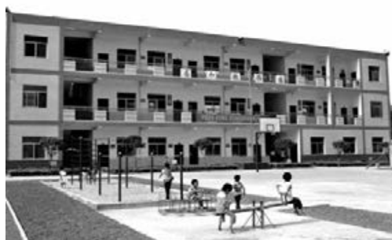
■ 長沙縣金井鄉松木村教學點的辦學條件得到了極大改善。

不漂亮，還要看教師隊伍強不強。」為此，長沙市啟動實施了名優教師隊伍建設「百千萬」工程和名優教師「英才培養工程」，制定《骨幹教師管理辦法》和《「英才工程」三年行動計劃》，推行骨幹教師滾動培訓、異地培訓模式，開展名優教師「志願支教、送課下鄉」等活動，兩年累計培養培訓市級以上骨幹教師3243人次，初步形成了骨幹教師梯級隊伍。