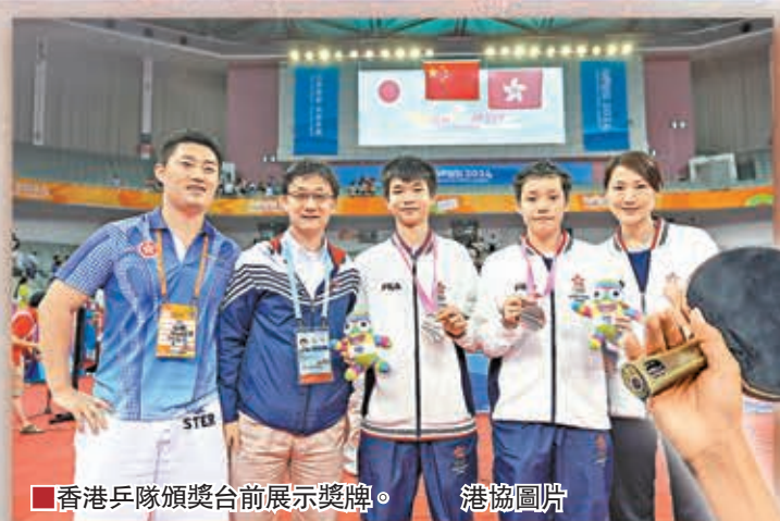
香港乒隊頒獎台前展示獎牌。

裝扮成碩碩升空的很有可能是塔溝武校的學生。閉幕式為下屆青奧會的舉辦城市布宜諾斯艾利斯提供了展示時間,他們將以短片的形式展現城市風采,但並無現場表演活動。