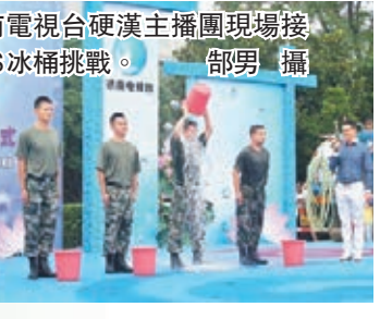
■濟南電視台硬漢主播團現場接受ALS冰桶挑戰。

山東 昨日上午，第二屆濟南泉水節在市民的潑水狂歡中拉開序幕。作為濟南市一年一度的城市節慶活動，本屆泉水節首次採用潑水狂歡的形式，傳遞親水、戲水、愛泉、護泉的理念。市民使用水盆等工具相互潑水，親身體驗泉水清涼。啟動儀式上，濟南電視台硬漢主播團現場接受ALS冰桶挑戰，關注漸凍人團體。