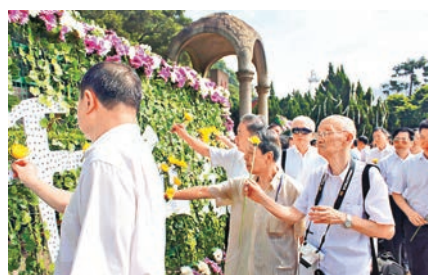
■兩岸各界人士為甲申馬江海戰及甲午海戰忠勇殉國將士獻花。

全國政協委員、前海軍軍副參謀長、南京軍區副司令員兼海軍東海艦隊司令員趙國鈞認為，甲午戰爭結束已經120年了，但中國仍然可以從當初的勝敗中反思、學習，這對中國未來的發展具有很強的現實意義。