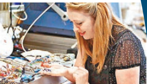
研究人員稱，智能皮膚可節省大量保養工序。 網上圖片