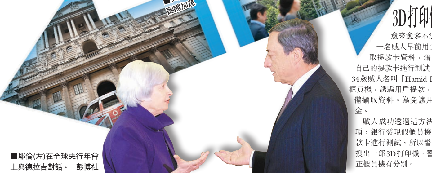
耶倫(左)在全球央行年會上與德拉吉對話。