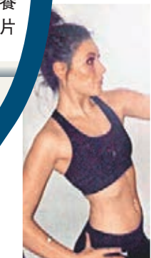
患厭食症時形容消瘦。