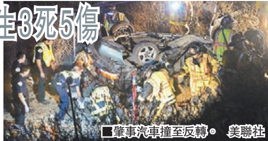
肇事汽車撞至反轉。

據日本駐洛杉磯總領事館透露，3名死者為駕車的19歲男性、20歲男性及18歲女性，另外2名女性和3名男性受傷。據當地媒體報導，5名傷者情況穩定。同校一名日本女留學生透露，事發前8人均為聖迭戈近郊的帕洛瑪學院新生，本月下