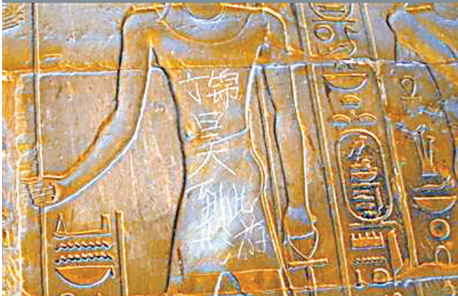
埃及盧克索神廟牆面被中國遊客刻上中文「到此一遊」。

香港文匯報訊(記者 胡璋燦 上海報道)從日前召開的上海市文明旅遊工作聯席會議傳來消息,上海有關部門擬建旅遊黑名單制度,並納入微信平台。部分中國遊客近年來在境外的不文明行為,如埃及盧克索神廟牆上驚現中文「到此一遊」等,引起非議。該制度建立後,在海外舉止不文明的中國遊客或將上黑名單,若他們再次出境,其申請將從嚴審批。