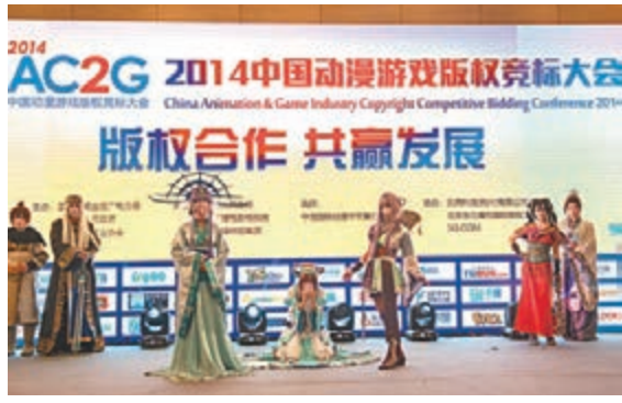
第十屆中國國際動漫節活動現場。

香港文匯報訊(記者 高施倩、實習記者 姚若辰 杭州報道)今年是中國國際動漫節開辦十周年。據杭州動漫產業日前出爐的數據顯示,上半年,杭州市共生產動畫片近4,200分鐘,動漫遊戲企業產值實現近20億元,漫畫、遊戲產量有明顯增長。