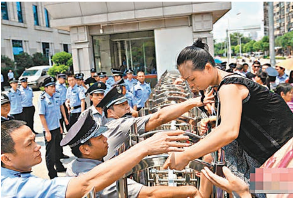
受害人親屬圍堵福州市中級人民法院大門。