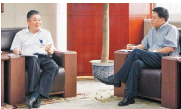
■中航工業董事長林左鳴在北京接受本報專訪。

在波音、空客等國際巨頭遭受世界經濟衰退影響之際，中航工業謀劃新局，收購多家海外知名企業，使它們成為中國航空產業中的一環，並帶領它們扭虧為盈。「航空工業必須靠全球市場支撐，但中國不像美國一樣，擁有北約、盟國等巨大市場，所以中國必須走一條與美國