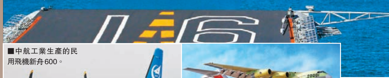
■中航工業生產的民用飛機新舟600。